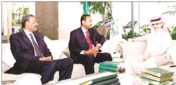
الأمير الوليد مع مستشار الرئيس السوداني الدكتور مصطفى عثمان ووزير السودان لدى الملكة الأميرة عائشة لبراهيم

الرياض / متابعة 14 أكتوبر / فراس الباهي: استقبل صاحب السمو الملكي الأمير الوليد بن طلال بن عبد العزيز آل سعود، رئيس مجلس إدارة شركة الملكة القابضة، سعادة الدكتور مصطفى عثمان إسماعيل مستشار فخامة الرئيس السوداني عمر البشير يرافقه سفير السودان لدى المملكة الأستاذ عبدالقادر إبراهيم محمد، وقد حضر اللقاء من جانب شركة الملكة القابضة الأستاذة نهلة العنبر، المساعدة التنفيذية الخاصة لسمو رئيس مجلس الإدارة. وفي بداية اللقاء، شكر الدكتور مصطفى عثمان سمو الأمير على إتاحة الفرصة للقاء سموه كسا إبلخ الأمير الوليد بتحيات الرئيس السوداني وسلم الأمير الوليد رسالة من فخامته. وتناول الطرفان خلال اللقاء العلاقات الثنائية والودية بين البلدين وتبرعات سمو الأمير محليا وإقليميا وعالميا. كما وجّه الدكتور مصطفى عثمان دعوة لسمو الأمير لزيارة