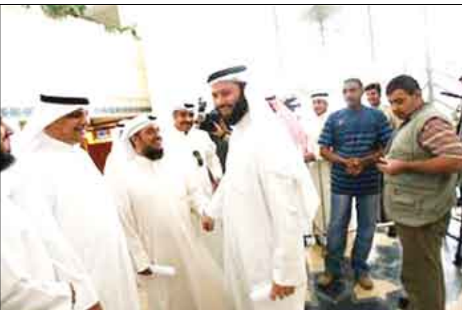
نواب إسلاميون في البرلمان الكويتي

نشرت عن 3 طلبات استجواب بحق رئيس الوزراء، ودعا الأمير الى انتخابات مبكرة في غضون شهرين ستكون ثاني انتخابات في البلاد منذ مايو 2008 والثالثة منذ يونيو 2006. ونذ الأمير، خلاله لإعلانه حل مجلس الأمة «بما تشهده الساحة البرلمانية من ممارسات مؤسفة شوهدت وجه الحرية والديمقراطية الكويتية»، مؤكدا أنه لن يتوانى عن اتخاذ أي قرار للحفاظ على أمن البلاد. واعتبر العبدلي أن الكويت شهدت خلال السنوات الثلاث الماضية واحدة من أكثر فترات عدم الاستقرار في تاريخها، أنه دليل على المرض الذي أثر في حياتنا..