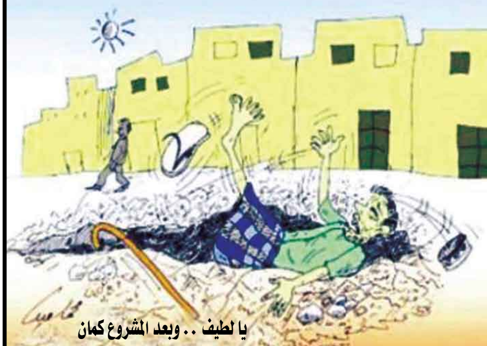
يا لطيف .. وبعد المشروع كمان