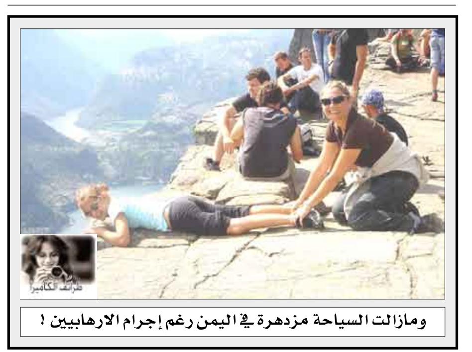
وما زالت السياحة مزدهرة في اليمن رغم إجرام الارهابيين!