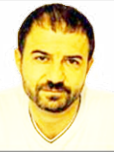
الشاعر السوري / حسين بن حمزة