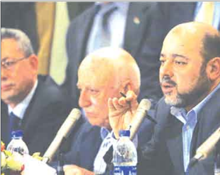
«تقدم ملموس» في حوار الفصائل، مشيرا إلى أن الجبهة قدمت مقترحا لتشكيل حكومة وطنية مستقلة لفترة انتقالية، وفي حال تعذر ذلك فإنه يوافق على دعم حكومة مختلفة تتألف من ممثلين من القوى والفصائل على أن تراهما شخصية وطنية مستقلة.

القاهرة / متابعة: تواصل لجان المصالحة الوطنية الفلسطينية بالقاهرة حواراتها اليوم السابع، وسط تقدم في ملف الانتخابات بعد الاتفاق على إجراء الانتخابات الرئاسية والتشريعية مطلع العام المقبل، وجمود في ملف تشكيل حكومة التوافق، في حين ربط الاتحاد الأوروبي بين تشكيل الحكومة وبين إعادة إعمار غزة.