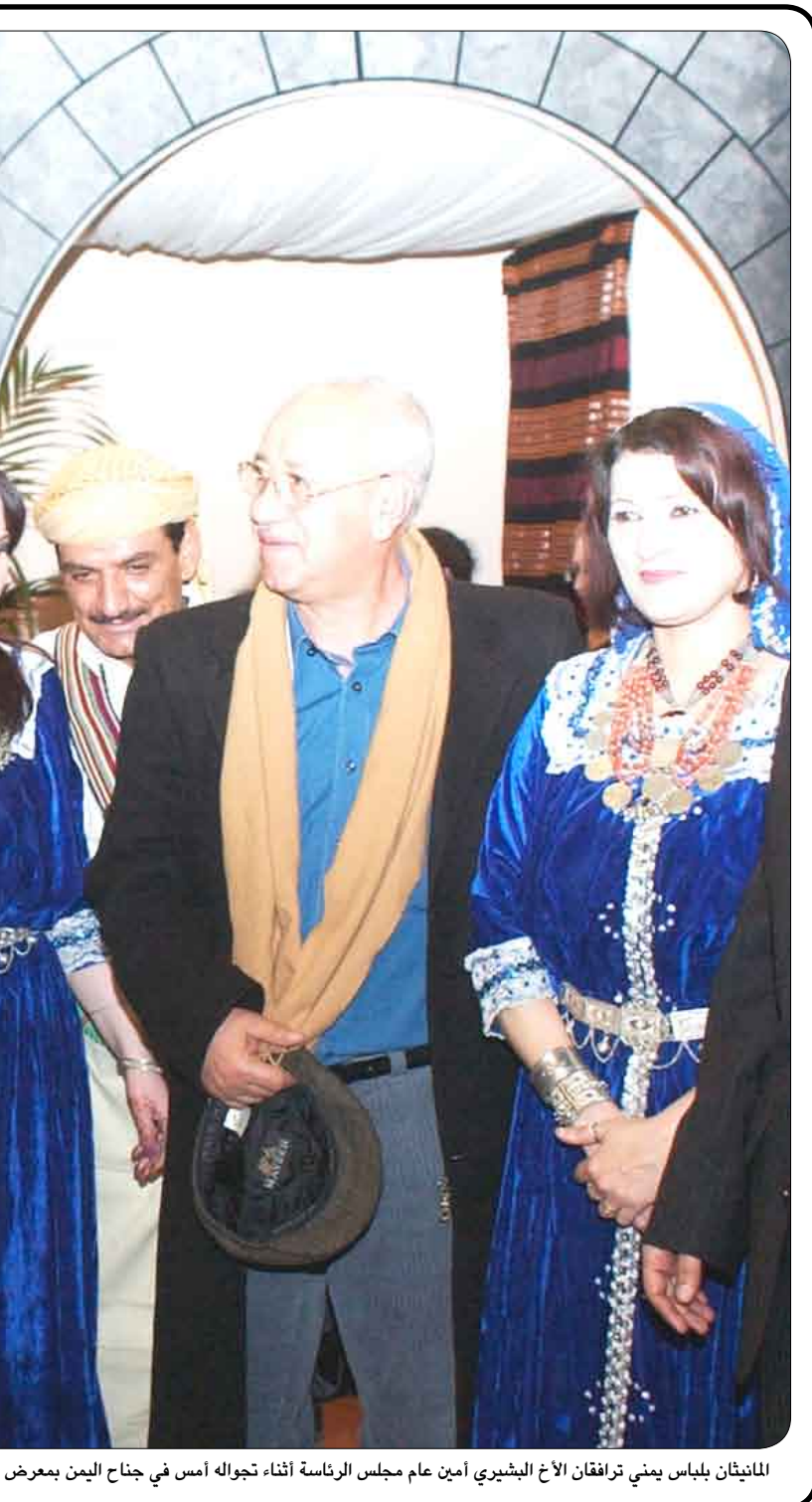
المنتان بلباس يمني تراقفان الأخ الشيبيري أمين عام مجلس الرئاسة أثناء تجواله أمس في جناح اليمن بمعرض برلين السياحي الدولي (ITB)

وزير الثقافة المعرض والذي اعتبره نواة للمعارض القادمة التي ستنتجها الوزارة في الأعوام المقبلة . بعد ذلك قام وزير الثقافة بزيارة تفقدية إلى بيت الأديب اليمني الراحل / علي احمد باكثير بمدينة سيئون الذي تجري فيه حالياً أعمال الترميم والصيانة بتبويل من قبل المجلس المحلي بالحفاظة . وفي الاحتفال التي وزير الثقافة كلمة أربح فيها عن إعجابها باللوحات الإنشائية التي تخللت المهرجان مشيداً بالتحضيرات التي سبقت فعاليات المهرجان .. هذا وقد تخلل حفل الختام تقديم عدد من الأناشيد الدينية لكوكبة من المنشدين اليمنيين ومن الوطن العربي والإسلامي.