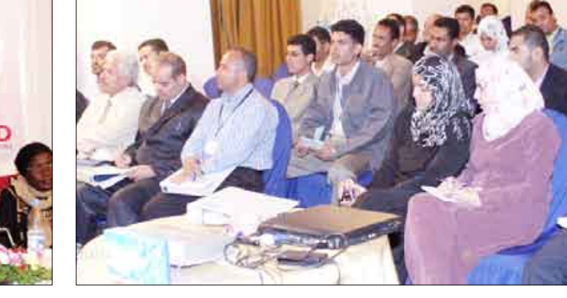
بمبادرة من اللجنة العليا للانتخابات وبالتعاون مع وسائل الإعلام، نظمت اللجنة العليا للانتخابات ورشة عمل تدريبية حول علاقة اللجنة العليا للانتخابات بوسائل الإعلام.

بالتعجيل في إصدار قانون الإعلام السلمي والبصري