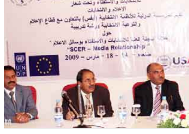
بمبادرة من اللجنة العليا للانتخابات وبالتعاون مع وسائل الإعلام، نظمت اللجنة العليا للانتخابات ورشة عمل تدريبية حول علاقة اللجنة العليا للانتخابات بوسائل الإعلام.

بمبادرة من اللجنة العليا للانتخابات وبالتعاون مع وسائل الإعلام، نظمت اللجنة العليا للانتخابات ورشة عمل تدريبية حول علاقة اللجنة العليا للانتخابات بوسائل الإعلام. حضر الورشة ممثلون من وسائل الإعلام والجنة العليا للانتخابات.