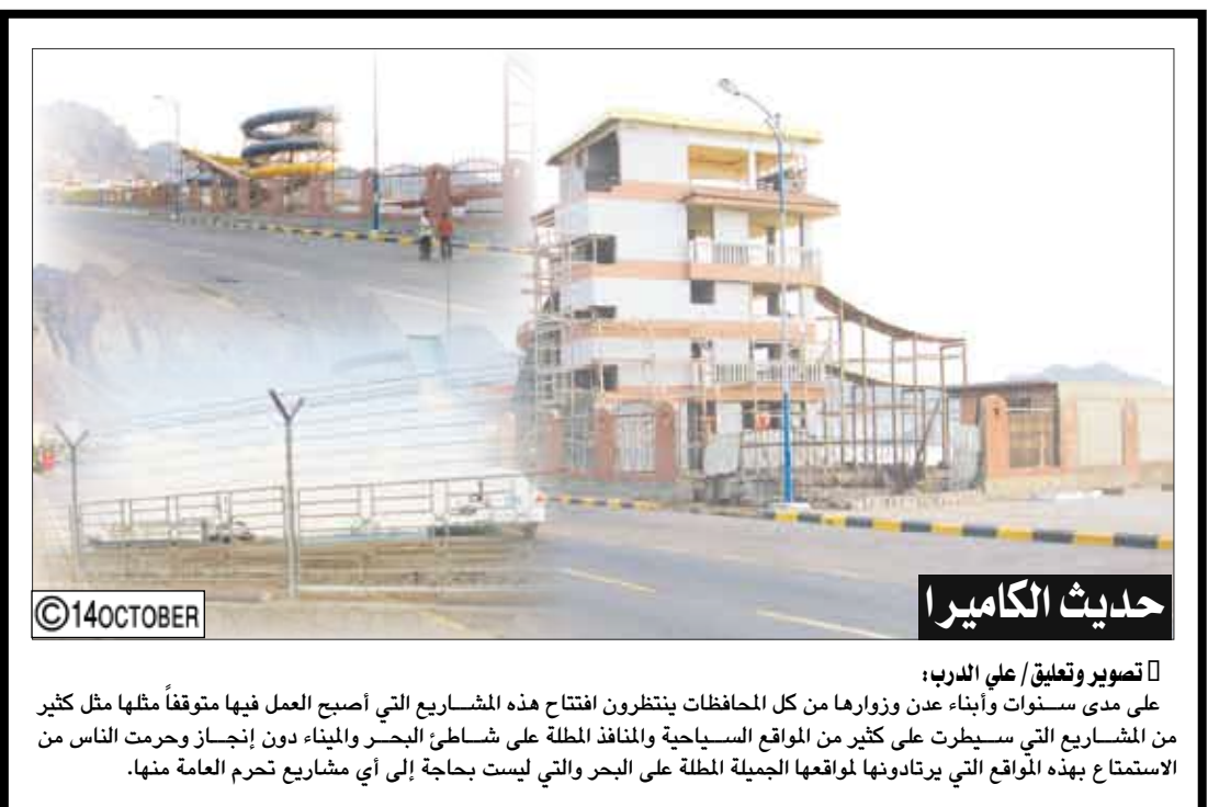
حديث الكاميرا تصوير وتعليق/ علي الدرب: على مدى سنوات وأبناء عدن وزوارها من كل المحافظات ينتظرون افتتاح هذه المشاريع التي أصبح العمل فيها متوقفاً مثلها مثل كثير من المشاريع التي سيطرت على كثير من المواقع السياحية والمناقد المطلة على شاطئ البحر والميناء دون إنجاز وحرمت الناس من الاستمتاع بهذه المواقع التي يرتادونها لمواقعها الجميلة المطلة على البحر والتي ليست بحاجة إلى أي مشاريع تحرم العامة منها.