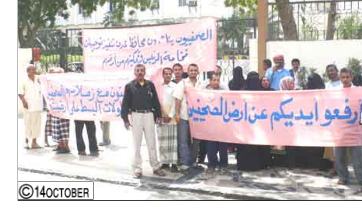
□ عدن/14 أكتوبر: نفذت الجمعية السكنية لعمال وصحفيي مؤسسة "14 أكتوبر" للصحافة والطباعة والنشر صباح أمس قراها بالاعتصام الاحتجاجي أمام ديوان محافظة عدن وشارك فيه عدد واسع من الصحافيين والصحافيات والعمالين والعمالات بالمؤسسة وعدد من زملائهم في المؤسسات الصحافية ومنظمات المجتمع المدني. وفي الاعتصام جدد الصحافيون ومناشدتهم فخامة الرئيس علي عبد الله صالح إلى التدخل العاجل ووضع حد لما يجري ضد أرضهم من استيلاء ونهب مدعوم من بعض المتنفذين. ودعا الصحافيون محافظ عدن مجدداً إلى الخروج عن صمته وإحقاق الحق باتخاذ الإجراءات الكفيلة بتمكين الصحافيين من أرضهم. كما ناشدوا المجلس المحلي بالتدخل العاجل ووضع حد لما يمارس من إحدى

الجهات المسؤولة في قيادة المحافظة حيث قدمت قيادة الجمعية شرحاً مفصلاً عن الجهود المبذولة في هذا الصدد، وأوضح أن هذه الجهود ما زالت تصطبم باللامبالاة التي تتعامل بها الجهات المعنية أمام ما يجري من استيلاء على أرض الجمعية. وقرر الاجتماع بالإجماع مواصلة الاعتصام ورفع برقيات عاجلة إلى مجلس النواب لإحاطته بمجريات الوضع وطلب تدخله العاجل كما قرروا مواصلة الاعتصام حتى تلبية مطالبهم الشرعية والقانونية. هذا وكان أعضاء الجمعية قد عبروا عن تقديرهم وشكرهم للتفاعل الواسع والتضامن الكبير الذي لقيته قضيتهم من زملائهم الصحافيين الذين توافدوا إلى موقع الاجتماع وكذا سيل الاتصالات التضامنية التي تسلموها من عدد واسع من زملاء المهنة من مختلف المحافظات.