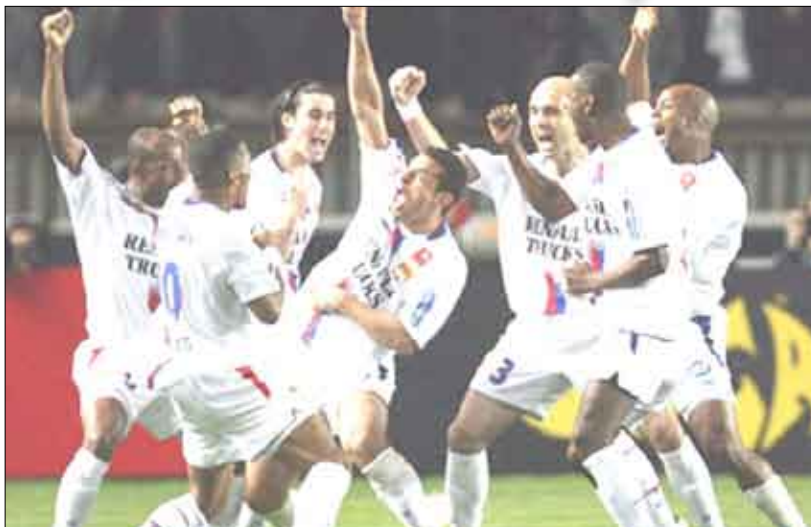
فريق أولمبيك ليون