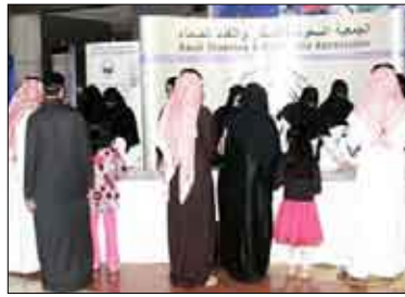
الثانية بعد الصوادم بين حالات الدخول الى المستشفى.

وأضاف: "المحزن لدينا أن نحو 40% من حالات جروح القدم السكري تنتهي بالبتير، وهذا يعود لإسهال في صحة المريض ومتابعة حالاته بشكل دقيق". وطالب القناص بأهمية الكشف المبكر لحصاة القدم السكري ونشر الوعي بين المرضى وصرف حذاء طبي ميطن لحماية المرضى من الكدمات. ووصف الوضع بأنه "مخيف" وعزا الى نظام غذائي سيئ والى قلة الحركة والتدخين. وقالت وحدة جراحة القدم والكاحل بمدينة الرياض في بيان صحفي اليوم السبت في مستشفى الملك عبدالعزيز الطبية للحرس الوطني بالرياض أن نحو 40 بالمئة من حالات جروح القدم السكري تنتهي بالبتير.