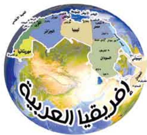
إعداد/ فاطمة رشاد

تونس/منايا: ألقى الدكتور عبد العزيز التويجري المدير العام للمنظمة الإسلامية للتربية والعلوم والثقافة كلمة رفع فيها عبارات التقدير للرئيس زين العابدين بن علي لدعمه الكبير لهذه المنظمة ورعايته لها وما يقوم به سيادته من جهود متميزة في مجال الحوار بين الثقافات والحضارات ولإسهامه في مساعي المجتمع الدولي لنشر قيم الاحترام المتبادل والتعايش والتسامح. وعبر عن اعتزازه بالمشاركة في موكب افتتاح "القبروان عاصمة للثقافة الإسلامية لسنة 2009" التي تقام تحت سامي إشراف الرئيس زين العابدين بن علي تقديرا من سيادته للأبعاد الحضارية التي ينطوي عليها الاحتفال بالقبروان عاصمة للثقافة الإسلامية لعام 2009 وتأكيدا لما يوليه من اهتمام للعمل الثقافي باعتباره الركن الأساسي لمفهومها العام ومدلولها الشامل في حجر الزاوية في البناء الحضاري للأمم وهي القاعدة المثبتة للإقلاع الاقتصادي وللازدهار الاجتماعي والتنمية الشاملة والمستدامة. وأوضح أن برنامج الاحتفال بمواضيع الثقافة الإسلامية الذي ترعاه وتنفذه المنظمة