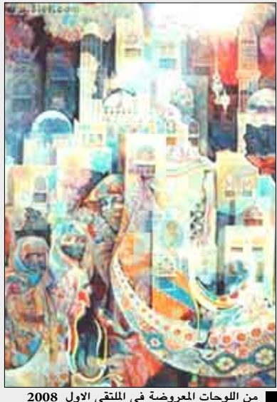
من اللوحات المعروضة في الملتقى الأول 2008

وهمشوا وتجاهلوا ذكر اسم هذين الفنانين والكاتبين لأنهم لا يريدون تطوير وازدهار العمل الفني كأحد محاور وركائز الثقافة المعاصرة فصدورهم تضيق من النقد لأنهم يعتقدون أنهم فوق النقد، ومن يعتقد أنه فوق النقد فإن الكبر وغرور النفس قد حجبا صاحبهما من الاستماع إلى الحق وإلى آراء الناس ومقترحاتهم البناءة الهادفة إلى