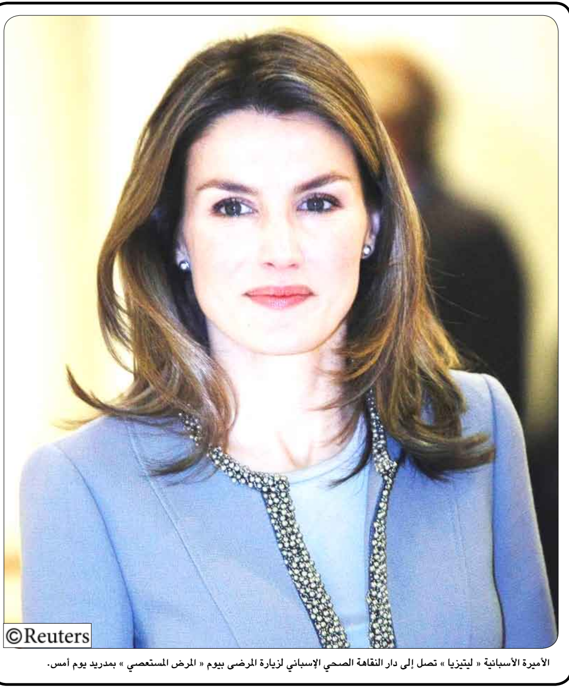
الأميرة الأسبانية « ليتيزيا » تصل إلى دار الرعاية الصحي الإسباني لزيارة المرضى بيوم « المرض المستعصي » بمدريد يوم أمس.

□ تعز/ نعام خالد: لم يتوقع سكان مديرية عسيفرة بتعز أن تكفي الفتاة (ت) أمها بثلاث طعانات غادرة كادت تودي بحياتها لولا مشيئة الله. فقد أثار هذا القضية استياء وحقن سكن المنطقة متساكين كيف يمكن لشخص أن يقدم على قتل من سهر عليه ورباه وتحمل مشاق العيش من أجله لأية أسباب مهما صغرت أو كبرت لا تعلمه الحق أو التبرير في ما أقدمت عليه الفتاة (ت) . وعلى اثر ذلك سارع رجال الامن إلى موقع الحادث وإلقاء القبض على الجانية وجمع الاستدالات من قبل شرطة عسيفرة وإحالتها إلى النيابة للتحقيق .