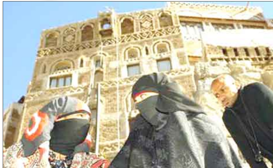
مشهد من فيلم رواي يمني اخراج خديجة السلامي

الشوارع ودور الصحافة في إبراز هذه القضية، وكذلك قضية المرأة العربية المثقفة في مجال الصحافة وأساليب العنف التي تمارس ضد الصحافة العربية