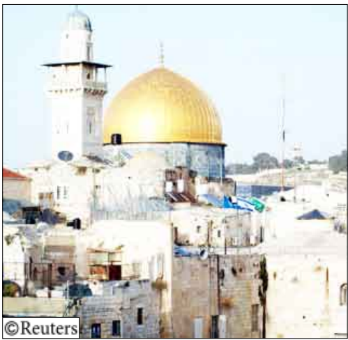
الموقع الذي تخطط إسرائيل لإقامة المركز الأمني فيه