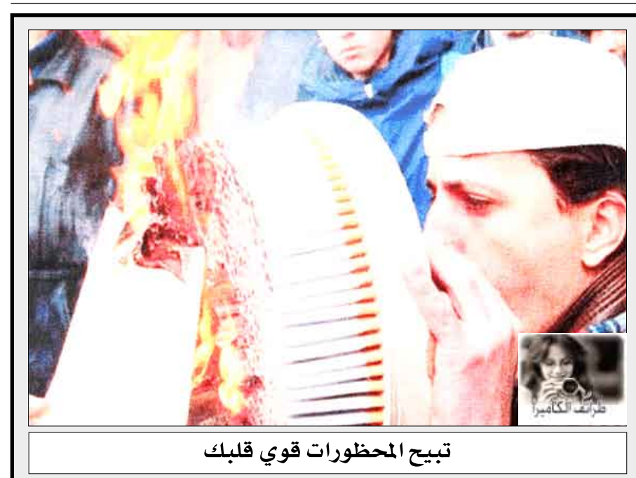
تبيع المحظورات قوي قلبك

تدرس النازية وقررتها التاريخية. وقد أخبر العاملون على تليفونات الطوارئ القاضي بهذه المعلومات، وقد اعترفت دونكومب بأنها تضع وقت الشرطة، ومن ثم فقد حكم عليها بغرامة قدرها مائتا جنيه استرليني