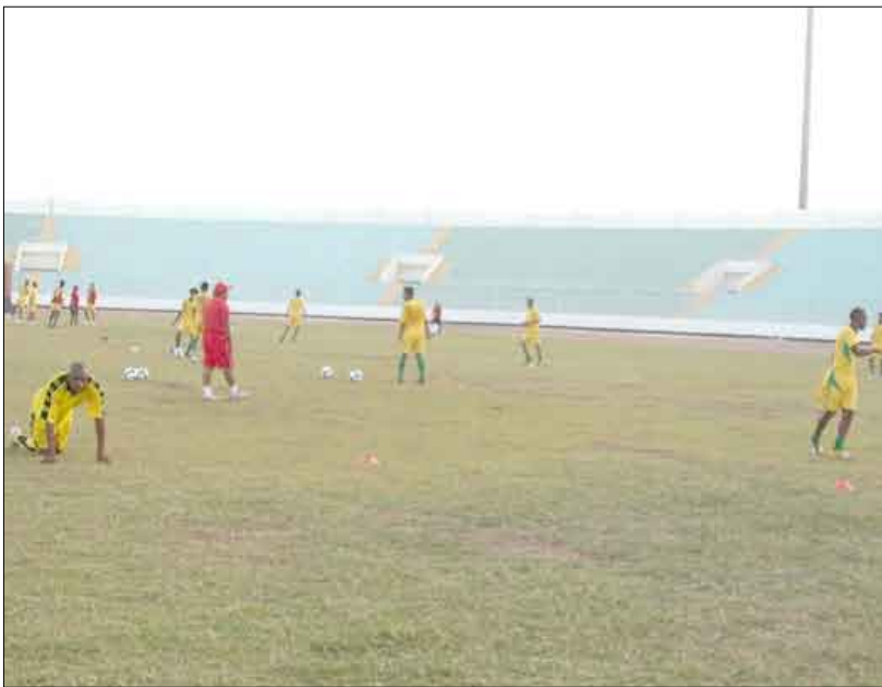
■ من تدريب التلال