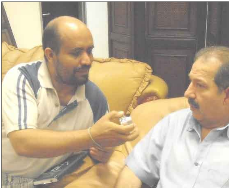
■ مدرب البسيتين