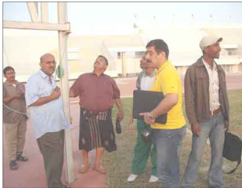
■ مراقب المباراة يتفقد الملعب مع اليماني