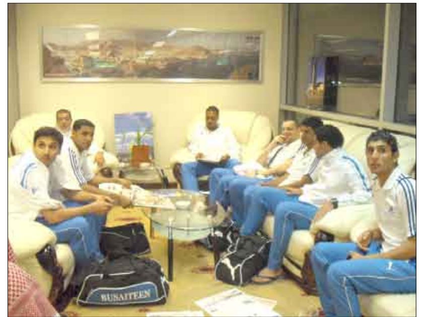
■ بعثة البسيتين