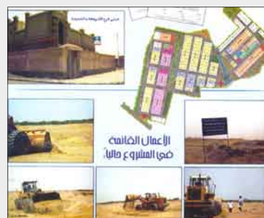
العمل الخاضع لسياسة الإسراع

خليجية أشاد رئيس السواعد العربية بالأعمال الجارية في الموقع على بعد 1000 متر من شارع جيزان بمدينة الحديدة مؤكداً ضرورة إنجاز عملية التسوية الأرضية في موعدها المحدد ما سيؤدي إلى الإسراع في تدشين البناء في المرحلة الأولى من المشروع والسفيرة بالفي وحدة سكنية في إطار مكونات المشروع البالغة خمس مراحل. وأوضح للصحيفة أن هذا المشروع الضخم الذي بدأ العد وقال تساهم في إنجاز المشروع شركات عريقة وذات مقدره وكفاءة عالية الأمر الذي يجعل للمواطن في حالة من الاستقرار العيشية وهو البلد بوجه عام.