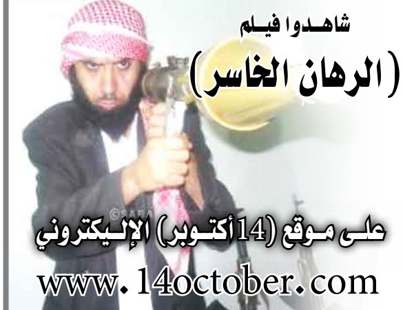
شاهدوا فيلم (الرهان الخاسر)

على موقع (14 أكتوبر) الإلكتروني www.14october.com