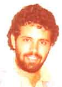
الشاعر فوزي غزلان