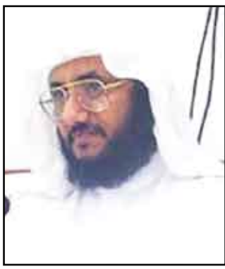
بـقـلم: الشيخ / حسن بن فرحان المالكي

فالشيخ يذكر أسباباً صغيرة مشتبهة لم تذكر في النصوص وليست متحققة ولا يؤدي أمر سبب في القسالة أم لا؟ ويترك الأسباب الكبرى المتفق عليها والمنصوص عليها في القرآن الكريم بأنها هي سبب قتال النبي (صلى الله عليه وآله وسلم) للكفار.