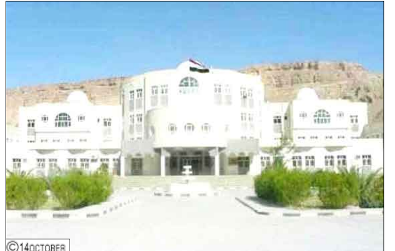
سيئون / أحمد سعيد زعل؛