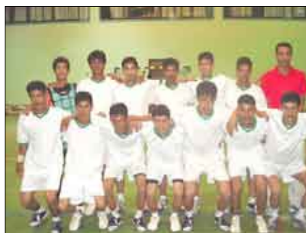
فريق شباب رخمة ذمار