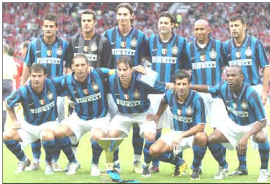
فريق إينتر ميلان