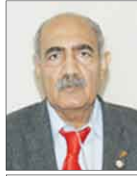
بقلم / أ. د. حسين محمد الكاف

(... إذا علمت شخصا بلغته فقد نقلت العلم إلى تلك اللغة، أما إذا علمته بلغة أخرى فلم تزد على أنك نقلت ذلك الشخص إليها).