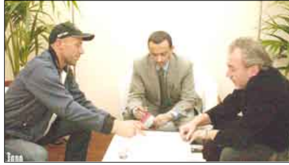
إيطاليا - ميلانو/سيا؛

السياحة، و«سيا» للسفرات والسياحة، وشركة الطيران الوطنية «اليمينة». وتأتي المشاركة اليمنية في المعرض بعد أن وسع اليمن من مكاتب التمثيل له من شركات العلاقات العامة في عدد من الأسواق السياحية الأوروبية والآسيوية وارتفاع عدد المعارض السياحية التي يشارك فيها إلى