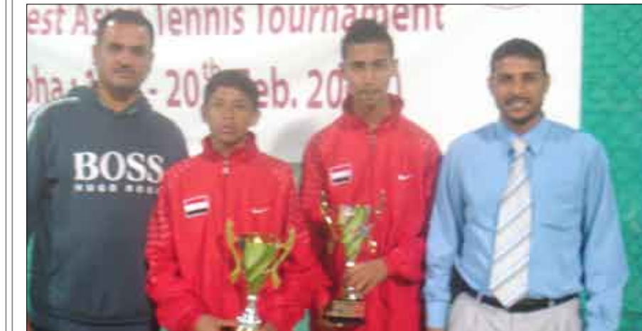
لقطة التكريم مع رئيس الاتحاد القطري

كما يتأهل أفضل فريق يحتل المركز الثالث من بين المجموعات الأربع في منطقة غرب آسيا، وأفضل فريق يحتل المركز الثالث في المجموعات الثلاث الخاصة بمنطقة شرق آسيا. ووقع منتخب الإمارات الفائز بلقب النسخة الماضية من البطولة عام 2008 في المجموعة الثانية التي تضم أيضاً سوريا وقطر والبحرين وبوتان وسريلانكا، ويستضيف الإمارات منافسات هذه المجموعة. وفي المقابل يلعب منتخب أوزبكستان وصيف بطل النسخة الماضية ضمن المجموعة الرابعة التي تقام منافساتها في باكستان والتي تضم إلى جانب أوزبكستان وباكستان كل من إيران ولبنان وتركمانستان والمالديف. أما منتخب السعودية الفائز بلقب البطولة مرتين فقد جاء بالمجموعة الثالثة التي تضم إلى جانبه كل من العراق وعمان والكويت والهند وأفغانستان، وسيتم تحديد مكان