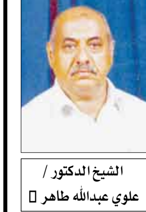
الشيخ الدكتور / علوي عبدالله طاهر

يقول الحسن البصري : " يا ابن آدم إنما أنت أيام ، كلما ذهب يوم ذهب بعضك" ، بما يعني أن الإنسان ليس جسداً ولا مالا ، وإنما هو وقت وزمن قصير يقاس بالأيام لا بالسنوات . فالإنسان العاقل ليس لديه وقت يضعه لأن اللحظة التي تمر عليه لا تعود أبداً .