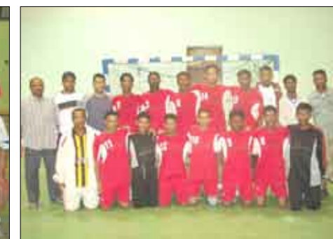
فريق شباب وحدة تريم