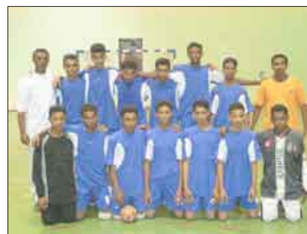
فريق شباب الجيل