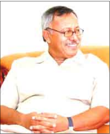
الدكتور/عبدالعزیز صالح بن حبتور