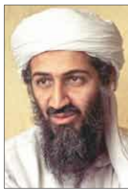
أسامة بن لادن

يرجع عدم الارتياح الذي تبديه مصر من تصميم "حماس" على أن تكون طرفا ضالعا في إدارة المعابر، وتحكمها في الأنفاق التي هي البديل غير الشرعي لتلك المعابر، .. يرجع ذلك إلى قضايا أمنية غاية في الخطورة على أمن المواطنين المصريين والأجانب في مصر، ليس هذا وحسب، ولكن إذا لم يكن الجانب الأمني المصري يقظا في هذا السياق لأصبحنا مرتعا لتنظيم "القاعدة" وقائده "أسامة بن لادن" عن طريق إخوة "حماس".