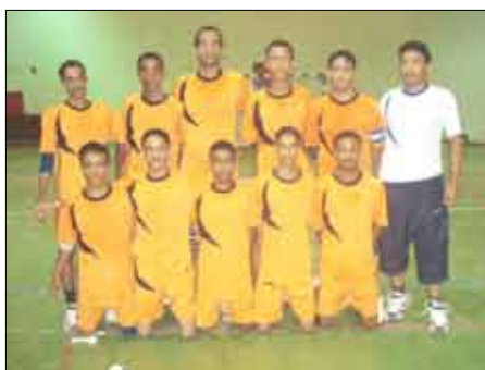
فريق شباب الصفر