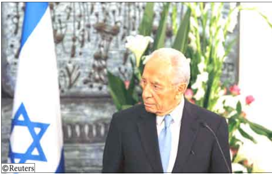
الرئيس الإسرائيلي شمعون بيريز

لغزة مفتوحة قاطنة إن ذلك سيعزز قبضة حماس على السلطة. وقال ريجيف إن مجلس الوزراء الإسرائيلي المصغر المعني بشؤون الأمن بحث عدد السجناء الذي ترغب إسرائيل في مبادلتهم بشليط لكنه امتنع عن الكشف عن أي أرقام أو أسماء. وقال «الوزراء يتقنون تماماً نوع الثمن الذي يحتاجه إطلاق سراح ديسمير كانون الثاني واستمر 22 يوماً. وقال مسؤولون فلسطينيون إن الهجوم الجوي والبحري والبري الذي شنته إسرائيل بهدف ملء حوض هجمات المواربيخ أدى إلى مقتل أكثر من 1300 فلسطيني وتدمير نحو خمسة آلاف منزل وقضى على معظم البنية الأساسية في غزة. وقال شارك ريجيف المتحدث باسم حماس في غزة. لكنه أصر على أن حماس لن تقبل أي ريب بين شليط والتهدئة المقترحة. وكانت إسرائيل مترددة في الدخول في اتفاق لإطلاق النار يطالبها بإبقاء المعايير الحدودية