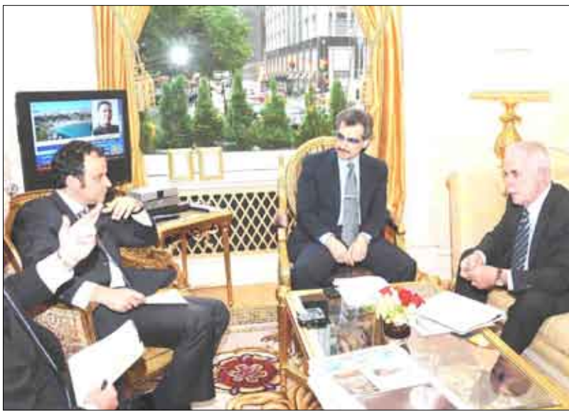
سمو الاميرالوليد مع السيد بيل فات الرئيس التنفيذي لفنادق ومنتجعات فيرمونت والسيد بي جي

في عام 2011م، وفي عام 2007م أتمت شركة الفيرمونت رافلز Fairmont - Fles العالمية للفنادق صفقة لبيع شركة لجاسي للفنادق والاستثمارات العقارية Legacy Hotels Real Estate Invest - ment Trust بقيمة 5.7 مليارات ريال سعودي محققة إيرادات قدرها 740 مليون ريال لشركة الملكة القابضة، وبيع فندق فيرمونت سويس أوتيل Fairmont Swissôtel في مدينة نيويورك، وإعادة تمويل فندق جورج الخامس فور سيزنز George V في باريس بصافي إيرادات تقدر بـ 285 مليون ريال، وإعادة تمويل فندق فور سيزنز دي بير Four Seasons Des Bergues في جنيف السويسرية بقيمة 375 مليون، وإعلان بيع فندق الفور سيزنز Four Se