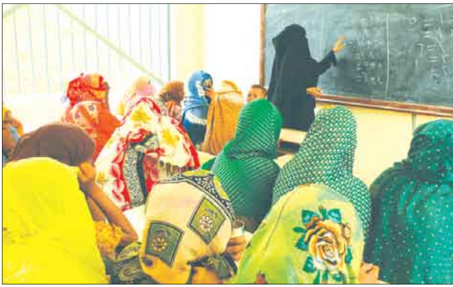
سجيبات في درس محو الأمية