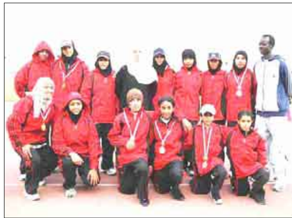
منتخب ألعاب القوى الأمانة