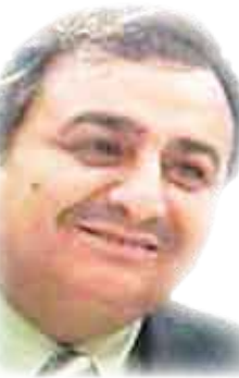
الشاعر العراقي / عامر مرزعي

تأخر آدم في أوبته إلى المقارة إثر يوم شاق شخ فيه الصيد وفوجئ بحواء حانقة وهي تمزق كل ما جمعه من أوراق الشجر شيابا له ، وراحت تتهمه بخيانتها !! ولم تطب نفسها إلا بعد أن أقسم لها اليمين بأن لا حواء أخرى تباريها على حبه!!