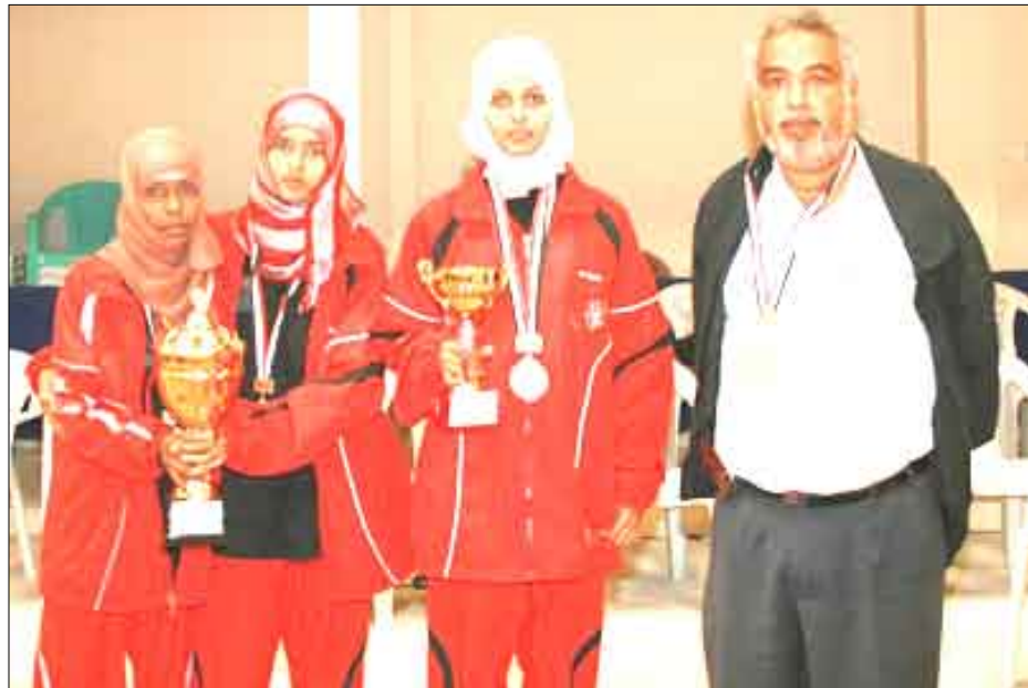
منتخب عدن للطاولة