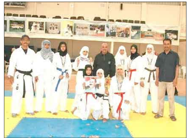
منتخب الأمانة للكراتيه