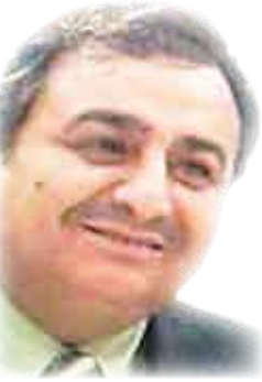
الشاعر العراقي / عامر مرزعي

تأخر آدم في أوبته إلى المفارقة إثريوم شاق شخ فيه الصيد وفوجئ بحواء حانقة وهي تمزق كل ما جمعه من أوراق الشجر شيابا له، وراحت تنتهمه بخيانتها !! ولم تطب نضها إلا بعد أن أقسم لها اليمين بأن لا حواء أخرى تباريها على حبه!!