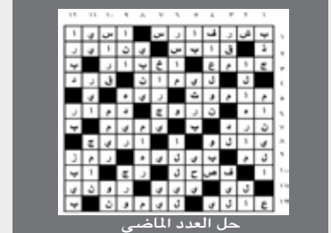
حل العدد الماضي

أفقياً: 1- أحد الأئمة الأعلام مؤسس المالكية أحد المذاهب الفقهية الكبرى في الإسلام ولد وتوفي بالمدينة له (الوطا) الذي هو أساس الذهب و (الرد على القدرية) و (الدونية الكبرى) لذهبه مكانة كبرى في المغرب - للنقي. 2- سلطخ - أول مركبة فضائية تحط على القمر عام 1959م. 3- تاسع سلاطين المماليك الأتراك في دهلي وأشهرهم حكم للفترة 1265م - 1287م وصعد غزو المغول - برهان. 4- قطع - حريق أبيض أو كتان - من الواس الخمس. 5- نأحية أو نوح - امبراطورية بيزنطية للفترة 797م-802م زوجة لاون الرابع ووصية على ابنها قسطنطين السادس دافعت عن الإيقونات وسعت لعدد مجمع نيقية الثاني. 6- معاهدة بين الكرسي الرسولي والحكومة الإيطالية تمت عام 1929م استغانت فيها البابا حقوقه الزمنية داخل دولة الفاتيكان - عارض. 7- ضمير - سهر ونهاس النوم في الليل - دفع معكوسة. 8- انضم - لاحق - خاصته. 9- أدخل وأخفى - من أهم الموانئ في فنلندا - حيوان. 10- أفضل لاعب كرة قدم في آسيا لعام 2000م. 11- المنسوب إلى اليد - اللداء - جواب. 12- نبات من فصيلة الشفويات طيب الرائحة - صوت الحمار. عمودياً: