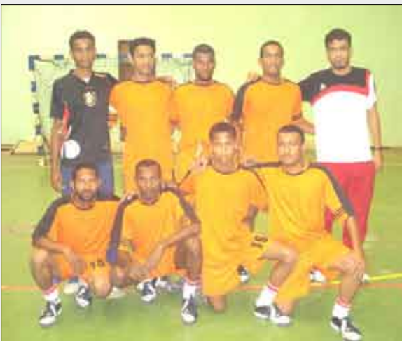
■ فريق الفجر