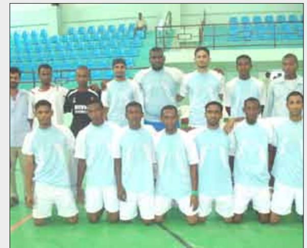
■ فريق الشراة لحج

1 - الشراة 4 نقاط 2 - 22 مايو نقطتان 3 - تضامن المكلا نقطتان 4 - سلام معبر - 5 - الرشيد يريم - المجموعة الثانية: 1 - وحدة عدن 3 نقاط 2 - هلال الحديدة نقطتان 3 - شباب القطن نقطتان 4 - الفجر الجديد نقطة واحدة