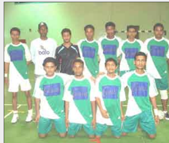
■ فريق وحدة عدن