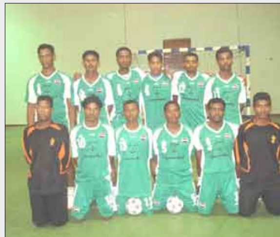
■ فريق شباب القطن