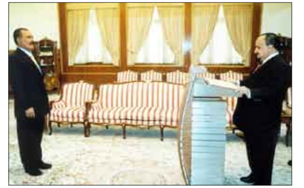
صنعاء / سبأ: أدى اليمين الدستورية أمس السبت أمام فخامة الأخ الرئيس علي عبدالله صالح رئيس الجمهورية الدكتور عبد الملك منصور مندوباً لبلادنا لدى جامعة الدول العربية.