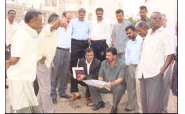
عدن / واد سبيل: أكد الدكتور عدنان عمر الجفري، محافظ صنعاء، ضرورة الاهتمام والحفاظ على المنجزات والأجواء اللامعة في مختلف مناطق مديرية المنصورة ومنها (حي السنافر) وبما يمكن الأطفال والشباب من ممارسة هواياتهم وقضاء أوقات الفراغ بعيداً عن الشوارع والطرق، داعياً الجهات ذات العلاقة بمكتب الأشغال إلى تخصيص مواقع مناسبة لتعام عليها مثل هذه الملاعب والمنزهات.