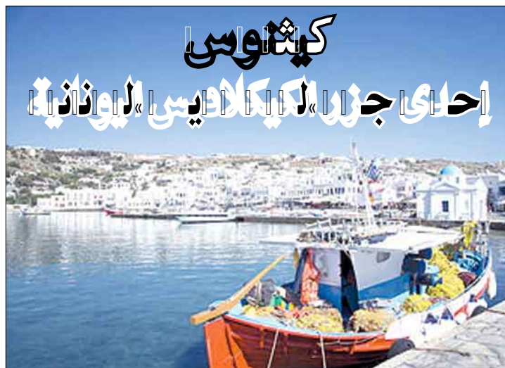
أيضاً بلدة كانالا في القسم الشرقي من الجزيرة التي تتمتع بشواطئ طويلة وكبيرة، وبلدة أغيوس ديميتريوس الحديثة في الجهة الجنوبية، وشمالاً هناك بلدة لوترا والمشارع الإنسانية العامة.

كثيوس من الجزر اليونانية المغمورة والصغيرة والحديدة أيضاً من الناحية الاقتصادية، وهي من مجموعة جزر الكيكلايس المعروفة، وبشكل خاص في القسم الجنوبي من بحر إيجة بين جزيرتي كيا وسريغوس. ولأنها غرب المجموعة فإنها أقرب إلى العاصمة أثينا ومرافئها الرئيسية بيرايوس، إلى الكثير من الجزر، إذ لا تبعد أكثر من 100 كلم، أي بين ساعة وأربع ساعات سفر بالسفن، وللجزيرة التي تبلغ مساحتها 100 كيلومتر مربع، مئة كيلومتر من الخط الساحلي وأكثر من 70 شاطئاً رملياً جميلاً. عاش سكان جزيرة كيثيوس في القرن التاسع عشر كراعاء وصيدان، إلا أن ضحالة الشواطئ ومياه البحر حرمت الجزيرة من المرافئ العميقة والقدرة على استقبال السفن الكبيرة وبالتالي ربطها بالعالم الخارجي بالشكل المطلوب لتطورها وافتتاحها سياحياً. ورغم أنها شحيحة من ناحية المواد الأولية الطبيعية، فقد عرفت فيها مناجم الحديد. وقد شكلت هذه المناجم مصدراً رئيسياً لدخل السكان قبل أن يهاجر معظمهم إلى