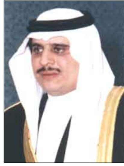
الأمير سلطان بن فهد بن عبدالعزيز