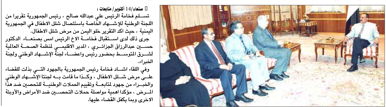
من منحه، 14 أكتوبر/منايعات : تسلم فخامة الرئيس علي عبدالله صالح ، رئيس الجمهورية تقريراً من اللجنة الوطنية للإشهاد الخاصة باستئصال شلل الأطفال في الجمهورية اليمنية ، حيث أكد التقرير خلو اليمن من مرض شلل الأطفال.