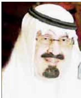
الملك عبدالله بن عبدالعزيز

التي يشهد بها الجميع بصفة عامة. وأعرب كوفي عن شكره وتقديره لخادم الحرمين المتحدة في كلمته عن شكره وتقديره لخادم الحرمين الشريفين على دعمه الكبير للبرنامج وتبرعه السخي الأشخاص في الدول النامية وهذا العمل الإنساني غير غريب على الملك عبدالله بن عبدالعزيز الذي أعرف شعوره الإنساني عندما يرى الظلم والجور". كما أعرب حازم بن محمد كركنتي سفير خادم الحرمين الشريفين لدى الاتحاد السويسري في كلمة مماثلة عن فخره واعتزازه بمنحه هذه الجائزة لخادم الحرمين الشريفين التي تعبر عن التقدير والاحترام الذي يحظى به، كما شغل حرصه على المساهمة في جميع الميادين التي تخدم الإنسانية وهذا ليس بغريب على ملك أسر القلوب بإنسانيته.