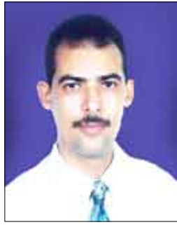
نصر ميارك باغريب

ربما تسعد الـ 800 مليار دولار التي أعلن عنها الرئيس الجديد باراك أوباما الأسبوع القادم على التخفيف الجزئي من وطأة الأزمة المالية التي عصفت بالولايات المتحدة وأصابت أسواق العالمية بالركود والانكماش الاقتصادي وتباطؤ النمو متأثرة بحالة الاقتصاد الأمريكي، ولكن هل نستمكن هذه المليارات من إعادة ماتمت خسارتها.