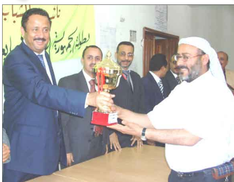
كأس المركز الثالث للحرازي