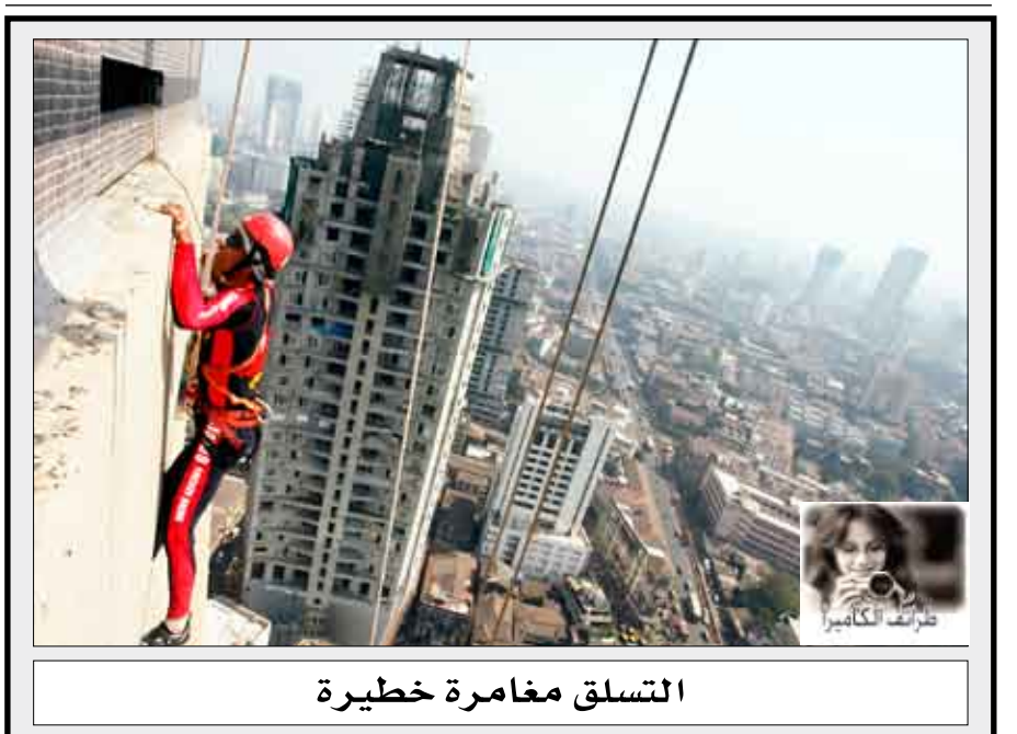
التسلق مغامرة خطيرة