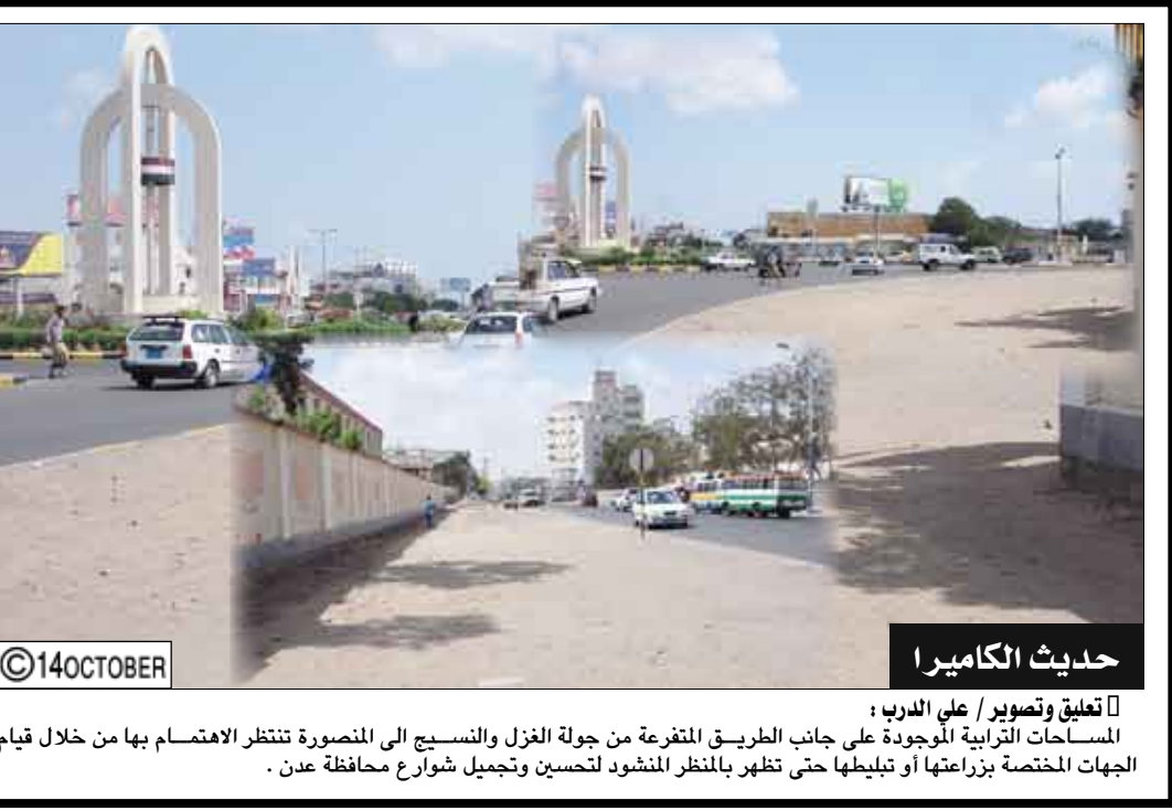
حديث الكاميرا الساحات الزراعية الموجودة على جانب الطريق المنفرعة من جولة الغزل والنسيج الى المنصورة تنتظر الاهتمام بها من خلال قيام الجهات المختصة بزراعتها أو تبييتها حتى تظهر بالمنظر المنشود لتحسين وتجميل شوارع محافظة عدن .