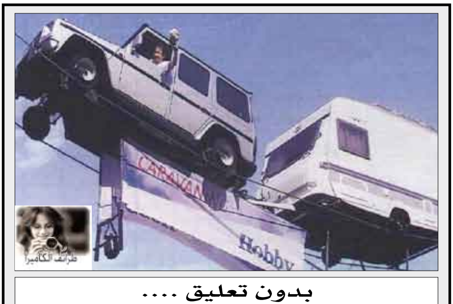
بدون تعليق ....

عمدت وزارة الخارجية البريطانية في الأونة الأخيرة إلى إمكانية إصدار جوازات سفر للقردة، في سابقة تعد بالكثير بالنسبة لتحديد وضع الحيوانات في الشريحة الاجتماعية لبلدان وفي الصورة التي ترونها يظهر لكم جواز القرده بيلي وهو يحصل على مميزات لجواز سفره في المطار. السؤال هل سيتم منحة فرصة الجولس بداخل كابينات المسافرين ؟ ..ربما سيكون سيكون هناك رخصة قيادة للقرود في المرة القادمة ؟ ..