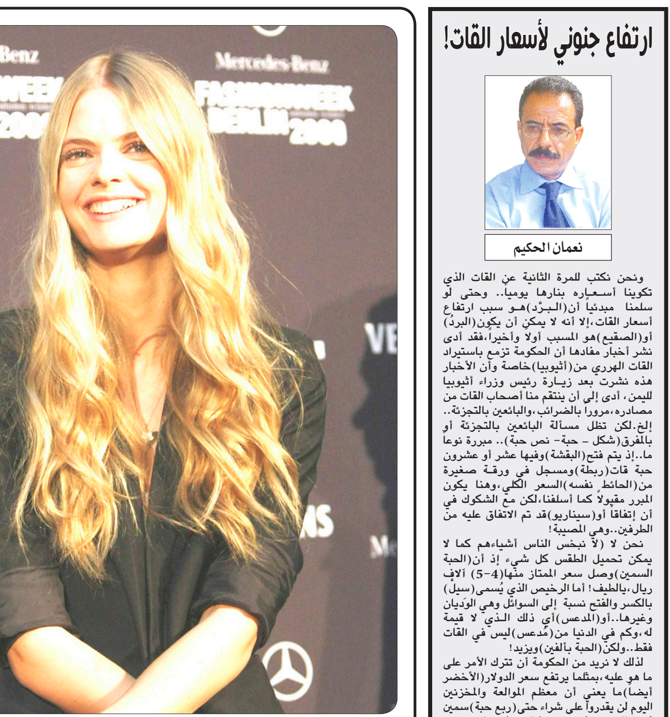
عارضة الأزياء الألمانية جوليان ستينجر حضرت أمس للتسجيل في أسبوع الأزياء ببرلين والذي يبدأ اليوم وحتى الأول من فبراير

□ عدن/ ذكري جوهر : تنظم مصلحة الدفاع المدني فرع محافظة عدن خلال الفترة من 9 وحتى 11 فبراير القادمين فندق "شيراتون" بعدن دورة تدريبية للإعلاميين والصحفيين في مجال "الدفاع المدني وإعلام الكوارث"، ذلك بمناسبة العيد الـ 18 لليوم العالمي للدفاع المدني الذي يصادف الأول من مارس القادم. وذكر الأخ العقيد / محمد عبده حيدر مدير عام