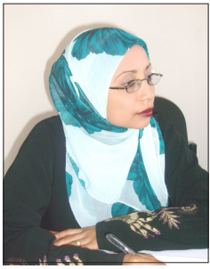
إيفاق سلطان سيّد

كشفت دراسة جديدة أن معظم النساء يجهلن المخاطر الصحية التي يخلفها التدخين.