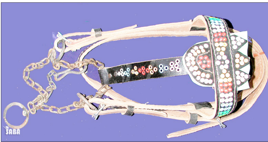
صنعاء / سبأ:

أكدت دراسة ميدانية أجرتها الهيئة العامة للآثار والمتاحف بالتعاون مع الصندوق الاجتماعي للتنمية في إطار برنامج الحفاظ على التراث الثقافي اليمني اندثار نحو /35/ في المائة من الحرف اليدوية والصناعات التقليدية التي عرفتها مدينة صنعاء حتى منتصف الأربعينات من القرن الماضي.