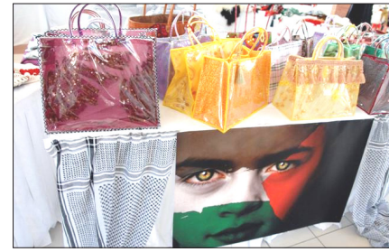
أكاديمية زايد للبنات تنظم سوقاً خيريّاً

ابوظبي/وام: تنظمت أكاديمية زايد الخاصة للبنات بالتعاون مع هيئة الهلال الأحمر سوقاً خيريّاً لمساندة أطفال غزة تحت شعار "نحن معكم".