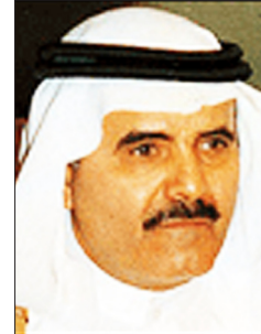
تركي عبد الله السديري

المحذر الذي تتجه فيه بعض القوى العربية نحو الخراب الشامل خطير للغاية، لهذا أرجو أن تكون المناقشة والحوار - من قبلنا كمجموع عربي معتدل ومقبول علنياً - أن تكون متجهة إلى عقل القارئ.. عقل المواطن المحتاج فعلاً إلى ترسيخ قناعاته بحقائق منطقية تجعله يساند قدرات الاعتدال في مهمة حمايته من مخاطر الانسحاق وراء ما يصبح أن يسمى بأشباه الدول وأشباه الحكومات.. حيث لا رصد مقنعاً دولياً أو محلياً في مواقع تحركاتهم يوحي للمواطن بالأمان..