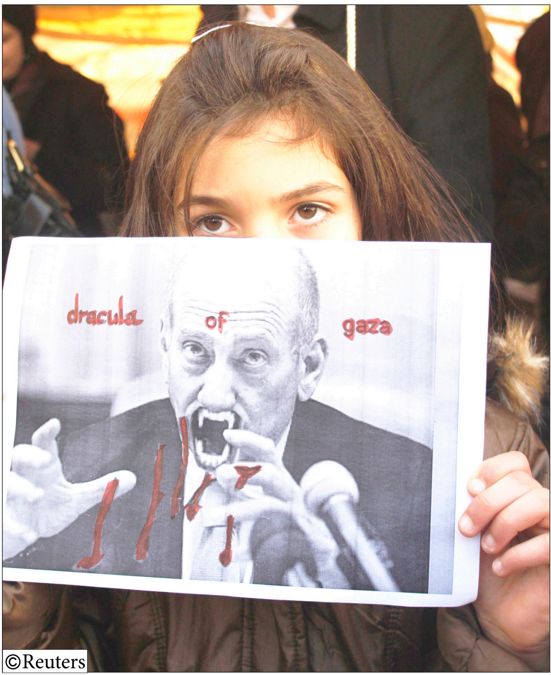
طفلة فلسطينية تحمل صورة تظهر رئيس الوزراء الإسرائيلي إيهود أولمرت بهيئة مصاص دماء غزة الباسلة في أثناء مظاهرة شعبية بنابلس في الضفة الغربية يوم أمس .

□ المكلا/ أشراف ياجبير : نظمت مؤسسة الصندوق الخيري للطلاب المتفوقين لجنة منتدتي الطلاب الخريجين يوم أمس بثنائية البناء للنبات بالمكلا محاضرة حول ( الإسعافات الأولية ) لفتيا وفاء بارودي من كلية التمريض بجامعة حضرموت. وفي ختام المحاضرة طرحت العديد من الاسئلة والاستفسارات من قبل طالبات الثانوية حول طرق الإسعافات الأولية الضرورية والتي يجب تحضيرها في البيوت وقامت المحاضرة بالررد عليها.