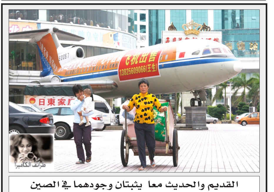
التقديم والحديث معا يثبتان وجودهما في الصين