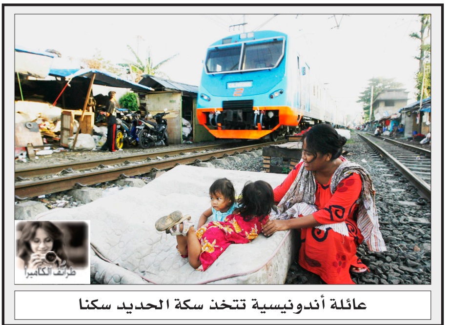
عائلة أندونيسية تتخذ سكة الحديد سكنا