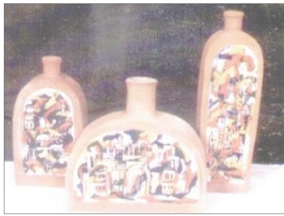
لوحة للفنان علي باراس

الفنان التشكيلي علي باراس من فناني «الفن الحديث» ذلك لأنه يسعى باستمرار إلى التجديد في معظم أعماله الفنية التي يقدمها للمعارض الفنية المحلية والدولية. والفنان التشكيلي علي باراس من مواليد مدينة عدن، وقد نشأ في أسرة يمنية تدعم الثقافة والفنون، ما ساعده على تلقي دراسته الأكاديمية في موسكو في معهد الفنون العالي وهناك برزت مواهبه الفنية وشارك في عدة معارض فنية منها معارض الرسم والنحت.