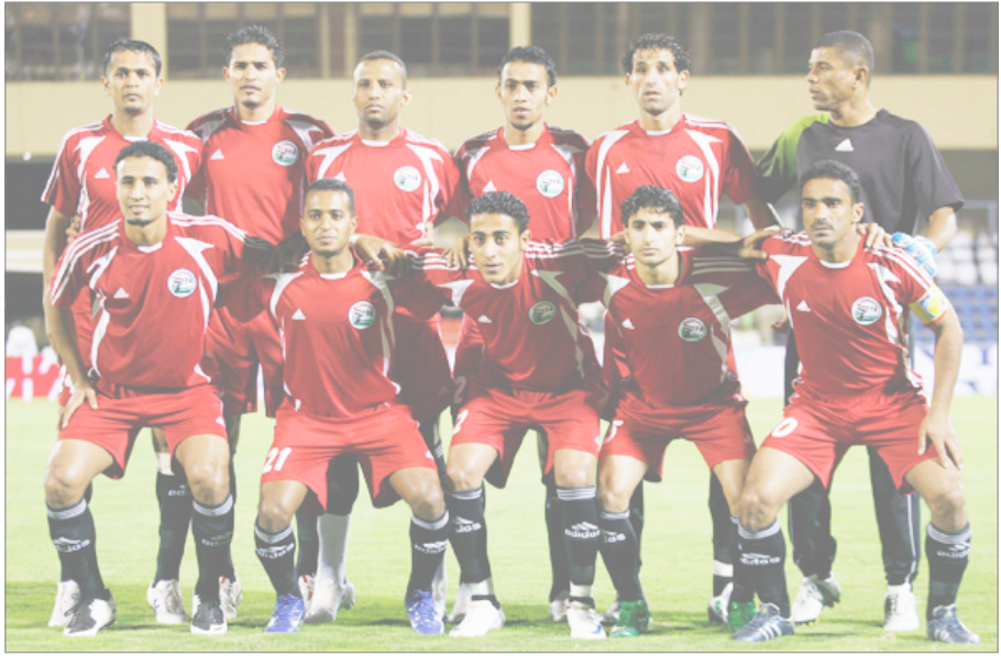
■ المنتخب الوطني