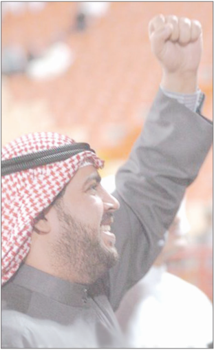
الشيخ أحمد الفهد

(خليجي 19) في عمان قد قصرت من حيث التنظيم والاستضافة وإنجاح البطولة.. بل نجحت بامتياز.. وأشعر شخصياً أن حقارة الاستقبال كان في مستوى يليق بسمة وكرم البلد المضيف (عمان). * وأحب أن أضيف نقطة هامة.. أقولها من هنا.. من (مسقط) علينا كأشقاء خليجيين أن نقف بيدا واحدة وكل قلبونا ويومنا نحو (اليمن) - التي تستضيف بعد (عامين).. (خليجي 20).. من أجل دعمها وتقديم كل العون والمساعدة لإنجاح هذه البطولة الهامة بالنسبة لنا بشكل خاص - حتى يكتمل حلم كل الرياضيين في اليمن خاصة والدول الخليجية الأخرى عامة وشهديد الكرة بالخليجي العربي فهد الأحمد الصباح - رحمة الله عليه - فالיום هنا.. في (مسقط).. وغداً سنكون جميعاً على أرض اليمن.