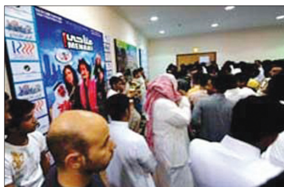
الاقبال الجماهيري خلال العرض

الرياض / منابعات: يشهد الفيلم السعودي الكوميدي «مناحي» الذي يعرض حالياً بمدينة جدة السعودية، اقبالا جماهيريا كبيرا، لدرجة تزاحم المواطنين على شباك التذاكر.