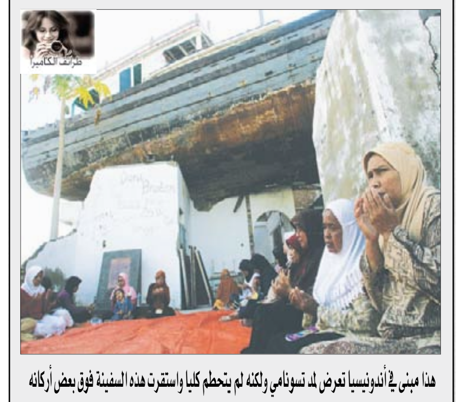
هذا مبنى في أندونيسيا تعرض لبلد تسونامي ولكنه لم يتحطم كلياً واستقرت هذه السفينة فوق بعض أركانه