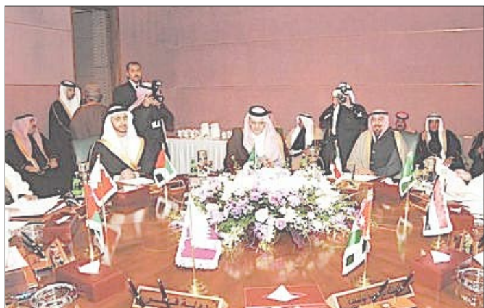
وزراء خارجية دول مجلس التعاون (أرشيف)