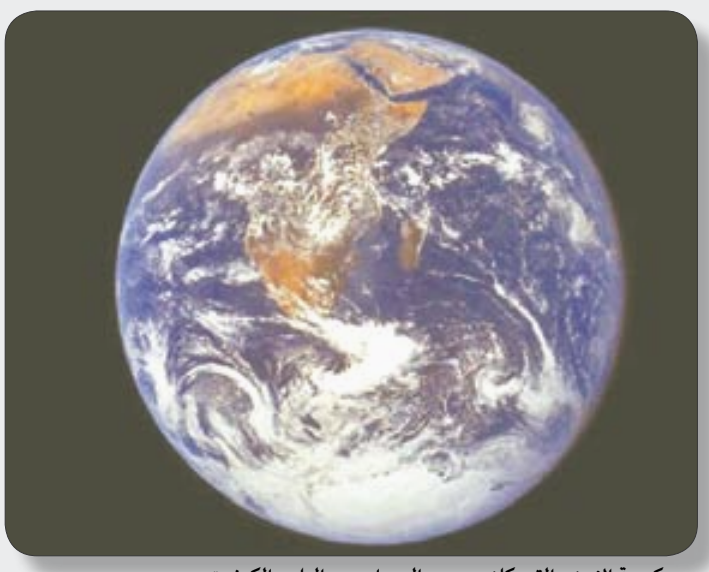
كروية الارض التي كانت محور الصراع بين العلم والكهنوت

واعترف الفاتيكان تدريجياً بأخطائه في قضية غاليليو الذي لم يحاكم بسبب نظرياته العلمية بالدرجة الأولى لكنه حاول ترويض التراجع عن الادانة بأن نظرية غاليلية التي تقول بكونية الارض ودورانها حول الشمس تنطوي على جوانب لاوثوية تخالف ما اجمع عليه رجال الدين المسيحيين الاسلاف !! وكان البابا الراحل يوحنا بولس الثاني قد بغاليليو عام 1992. ومن المقرر إقامة تمثال لهذا العالم في العام القادم 2009 في حدائق الفاتيكان. من جانبها أعلنت الأمم المتحدة اعتبار العام 2009 العام العالمي للفلك احتفالاً بذكرى استخدام غاليليو لتلسكوبها لأول مرة.