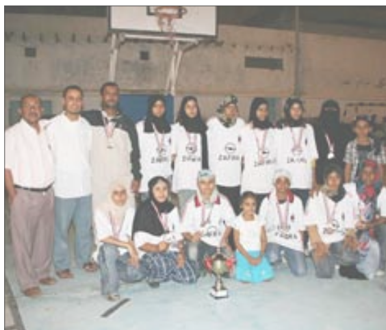
منتخب مدارس عدن