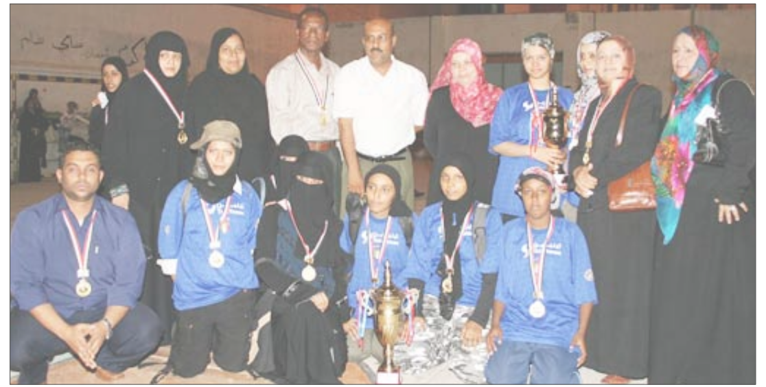
منتخب جامعة عدن