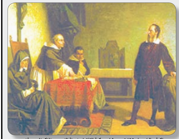
محكمة جاليليو عام 1633م من قبل محكمة التفتيش (مبنى النبي عن النكر المسيحية)