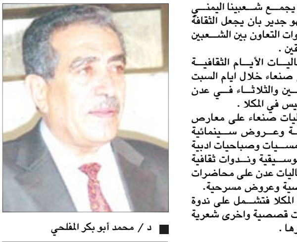
د / محمد أبو بكر المحلحي

وقال : ما يجمع شعبينا اليمني والسعودي لهو جدير بان يجعل الثقافة هي افضل قنوات التعاون بين الشعبين والبلدين الشقيقين . وتتوزع فعاليات الأيام الثقافية السعودية في صنعاء خلال ايام السبت والاحد والاثنين والثلاثاء في عدن والأربعاء والخميس في المكلا . وتشتمل فعاليات صنعاء على معارض فنون بصرية وعروض سينمائية ومحاضرات وامسيات وصباحيات ادبية وفلكلورية وموسيقية وندوات ثقافية فيما تشتمل فعاليات عدن على محاضرات وامسيات قصصية وعروض مسرحية. اما فعاليات المكلا فتشتمل على ندوة ادبية وامسيات قصصية واخرى شعرية ومسرحية وغيرها.