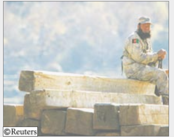
كابول 14 أكتوبر / رويترز: أعلن رئيس هيئة الأركان الأمريكية المشتركة الجنرال مايك مولن زيادة عدد القوات الأمريكية في أفغانستان إلى قرابة الضعف مطلع هذا الأسبوع ثم اتجه شرقاً لتهدئة التوتر بين باكستان والهند. السبب؟ إن هذا كله جزء من نفس المعادلة الأمنية.

إذا كانت زيادة عدد القوات بإرسال ما يصل إلى 30 ألف جندي إضافي إلى أفغانستان بحلول الصيف القادم هي التكتك الذي وقع عليه الاختيار للتغلب على تمرد طالبان هناك فإن الجولولة دون لأشتياك بين الهند وباكستان في الاستراتيجية التي تضمن تحقيق السلام في أنحاء المنطقة بأسرها. وقال براهما تشيلاني أستاذ الدراسات الإستراتيجية مركز أبحاث السياسة في نيودلهي «الزيادة ليست حلا في حد ذاتها. ليس عدد القوات بل الإستراتيجية».