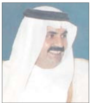
الشيخ حمد بن خليفة آل ثاني

الثقافة العربية ويصبح من الضروري كشف وتحليل طبيعة صورة أمريكا في كافة جوانب الثقافة العربية الحديثة لما لذلك من أهمية كبيرة من خلال عقد ندوة لمدة 3 أيام ضمن النشاط الثقافي للمصاحب للمعرض. وأضاف ان الندوة سيتم فيها مناقشة التفاعل بين الثقافتين الأمريكية والعربية والعلو الثقافي الأمريكي وبعض الموضوعات المتعلقة بالادب والاعلام وأمريكا في السينما العربية كما ستتضمن عرض لـ 10 أفلام روائية أمريكية على مدار عشر أيام بالإضافة إلى عرض للصور الفوتوغرافية موضحاً انه سيشترك ضمن المشتركين في المعرض عدد 6 ناشرين من الولايات المتحدة الأمريكية بالإضافة إلى اللجنة الثقافية الأمريكية بالدوحة على مساحة 320 متراً مربعاً. وأوضح سعادة السيد مبارك بن ناصر ال خليفة قائلاً في ختام مؤتمره الصحفي انه في اطار الحرص على القيام بدورنا في المجتمع القطري في تنمية الثقافة والقدرة الإبداعية وغرس حب القراءة لدى الأطفال والطلاب في مختلف مراحلهم الدراسية جعلنا ننشئ مشروع دولة تقرأ أمة ترقى // وهو المشروع الاول من نوعه داخل دولة قطر وذلك بهدف تشجيع وتحفيز الطلاب من مختلف المراحل على القراءة والاطلاع وتعليمهم كيفية اختيار اوعية المعلومات المختلفة والمشاركة في معرض الدوحة للكتاب وتشجيعهم على اختيار الكتب التي تناسبهم والتي تدخل في دائرة اهتمامهم الثقافية والدراسية والعلمية.. مؤكداً انه تم لهذا الغرض توزيع كويونات مجانية ذات قيمة مالية للشراء من معرض الكتاب لطلاب المدارس من مختلف المراحل الدراسية.