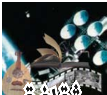
إعداد/ جلال أحمد سعيد