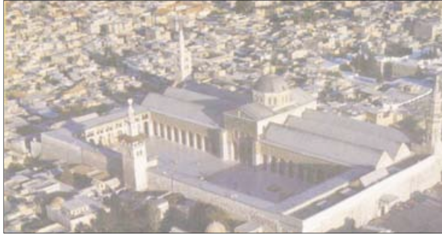
العاصمة السورية دمشق