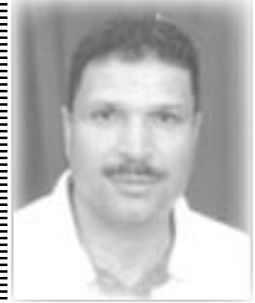
الشاعر المصري / حسين القباحي

قلت: تهين للرفض والموت المعايير في حشاشات الانتظار أنني أفرطت من زمن به الشعراء ينتحلون رؤوسهم ويستجدون تذكرة التعري فوق خارطة تزول قلت: السماء بدياتي... كانت وهذي الأرض مشقة وأنت حناجر الرانين للجلبل الملق والشهيد