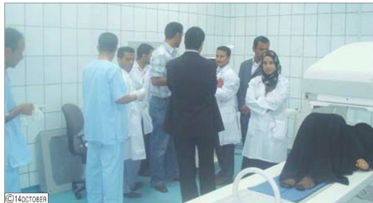
أحد المرضى يخضع للفحص والعلاج في المركز

أخر. وتتركز المادة المشعة في العضو المراد فحصه ويتم وضع المريض بالقرب من جهاز جاما للتصوير الذي يلتقط الأشعة الصادرة من العضو المراد تصويره. هناك عدة طرق للتصوير فهناك التصوير الثابت والتصوير المتحرك حيث يدور الجهاز حول المريض لالتقاط صور من جهات متعددة. كذلك هناك التصوير الكامل للجسم حيث يتحرك الجهاز على طول جسم المريض ليلتقط صوراً كاملة للجسم من الأمام ومن الخلف وهذا يستخدم عادةً لتصوير الهيكل العظمي للمريض. ويستخدم جهاز الجاما كاميرا كجهاز رئيسي في هذا المجال ولكن هناك أجهزة فرعية يتم استخدامها مثل:جهاز قياس نشاط الغدة الدرقية وجهاز الجاما بروب (مسبار الجاما) الذي يُساعد الجراحين على تحديد الغدة الليمفاوية المصابة بالسرطان وأماكن تواجد السرطان أثناء العملية الجراحية.