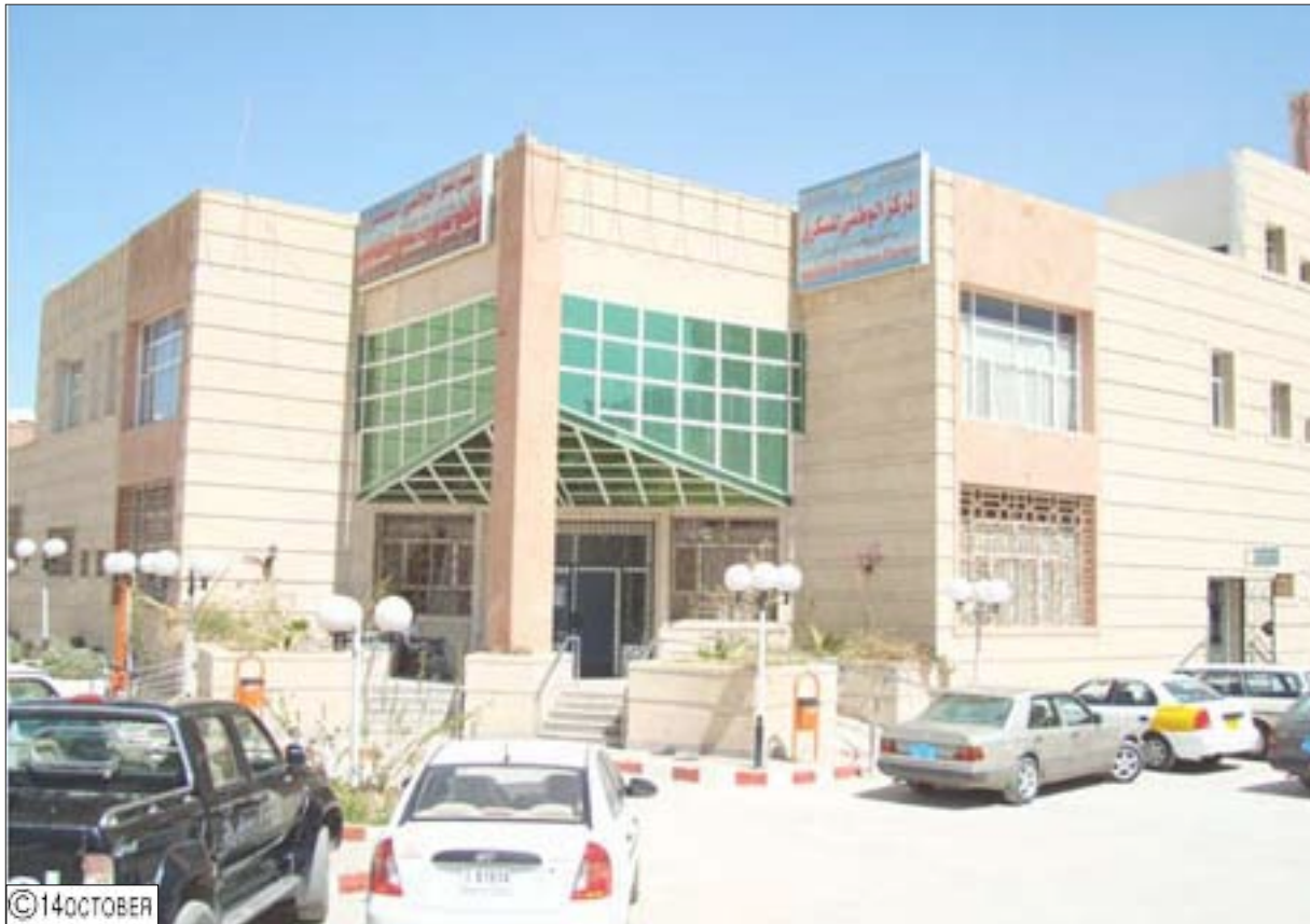
مركز الطب النووي مستشفى الثورة بصنعاء

بكميات كافية في الأماكن المصابة بالمرض دون التأثير على الأمان السليمة من الجسم. ويقوم الطب النووي في المركز بعلاج مرض فرط نشاط الغدة الدرقية باستخدام اليود المشع وعلاج سرطان الغدة الدرقية باليود المشع بعد إجراء العملية الجراحية. وسيتم إدخال مواد إشعاعية مُعدّمة عالمياً أثبتت كفاءتها في علاج بعض الأمراض السرطانية للعقد العصبية والغدد الصماء. وكذلك مواد أخرى لعلاج أمراض التهابات المفاصل والأمراض السرطانية المنتشرة للغشاء المبطن للثة والبطن حيث يمنع التجمع المتكرر للسوائل في هذه الأماكن. وسيتم استعمال مادة لعلاج سرطان الغدة الليمفاوية التي لا تتجاوب للعلاج بواسطة الإشعاع أو المواد الكيميائية.