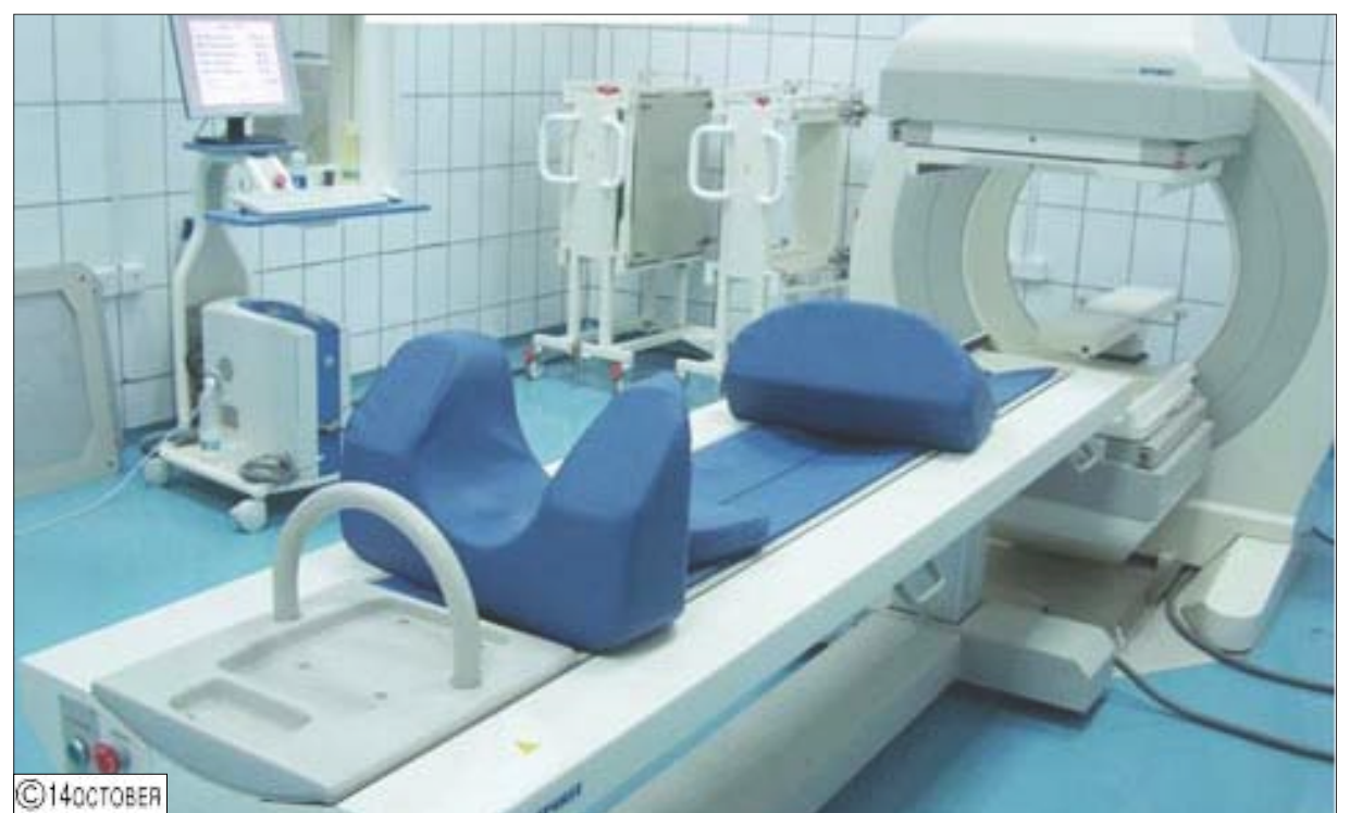
جهاز جاما للتصوير الموجود في المركز