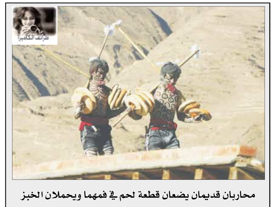
محاربان قديمان يضعان قطعة لحم في فمهما ويحملان الخبز