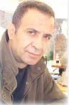
الشاعر الفلسطيني/ منير مزيد