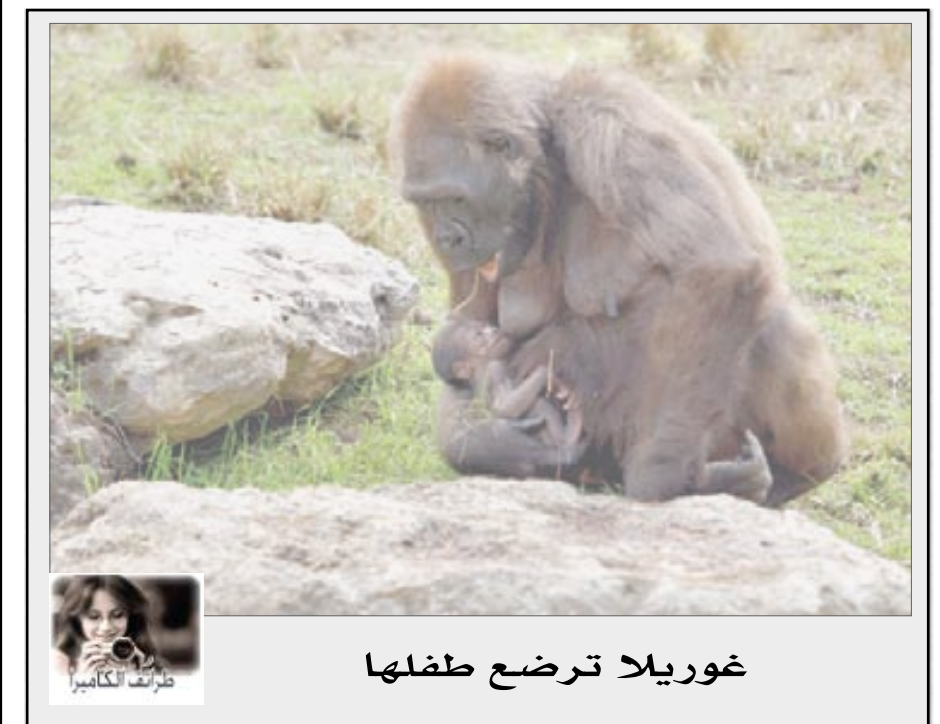
غوريلا ترضع طفلها