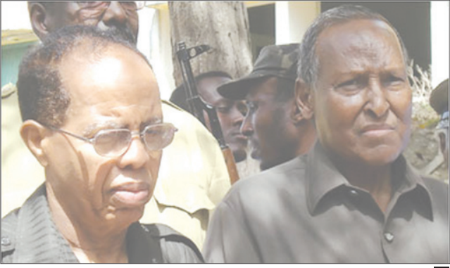
الرئيس الصومالي عبدالله يوسف ورش الوزراء المقال نور حسين حسن

البلاد الواقعة بمنطقة القرن الإفريقي. وقالت كينيا أمس الثلاثاء إنها لا تعترف برئيس الوزراء الجديد واتهمت يوسف بتصعيد مشكلات الصومال. وكانت كينيا استضافت محادثات تشكيل الحكومة الانتقالية. وقال وزير الخارجية الكيني موسى ويتانجولا في مؤتمر صحفي «إذا واصل الزعماء الصوماليون تعريض عملية السلام للخطر ستفرض كينيا عقوبات».