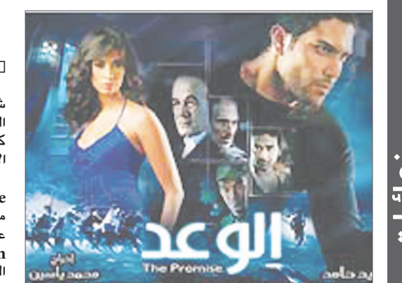
المصنع الدعائي لفيلم الوعد

قال المتحدث الإعلامي بشركة «ميديا هاوس» Media House في تصريح صحفي: «الآن أصبح متاحاً للجمهور متابعة تفاصيل فيلم "الوعد" عن طريق العنوان التالي wwww.alwa3dmovie.com والتفاصيل التي نشرت عن الفيلم في الصحف والمجلات بالإضافة إلى تفاصيل حدثت وقت التصوير وصور من الفيلم ومن الكواليس» كما يحتوي الموقع على جزء خاص بالفيديو يقدم إعلان الفيلم وأغنيته، إلى جانب العديد من الهدايا