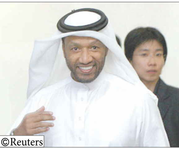
القنري محمد بن همام

مصلحة اللاعبين والإداريين الكويتيين». وأضاف بن همام، «كويتي رئيساً للاتحاد القاري، فإن واجبي يحتم علي التدخل من أجل حماية كرة القدم واللاعبين في الكويت. أرى أنه من الواجب الآن أن أطلب من الـ (فيفا) أن يرفع الإيقاف بشكل مؤقت، وذلك من أجل السماح للكويت بالمشاركة في البطولات التي ستقام في المستقبل القريب، بما في ذلك كأس الخليج وتصفيات كأس آسيا المقررة الشهر المقبل».