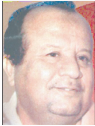
الشاعر حسين ابوبكر المحضار