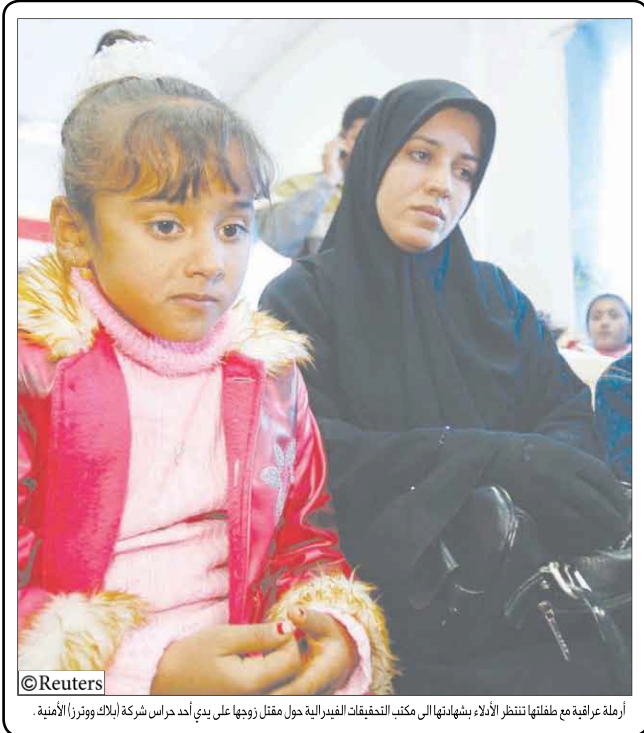
أرملة عراقية مع طفلتها تنتظر الألاء بشهادتها إلى مكتب التحقيقات الفيدرالية حول مقتل زوجها على يدي أحد حراس شركة (بلاك ووترز) الأمنية.