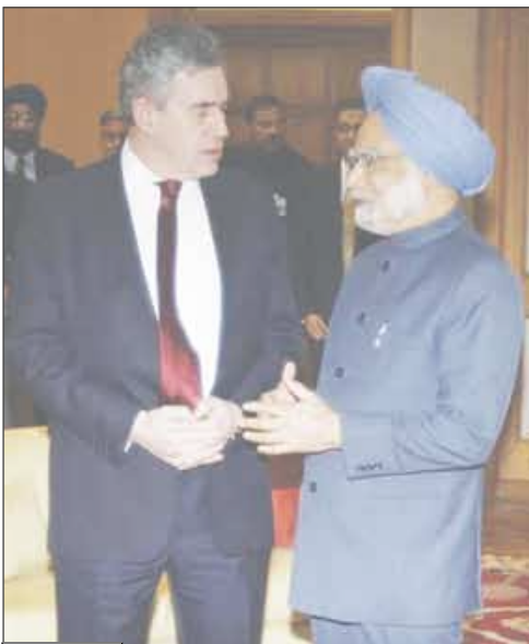
رئيس الوزراء البريطاني جوردون براون يتحدث مع نظيره الهندي مانموهان سينغ في نيودلهي يوم الأحد

وأضاف "الرسائل التي أرسلتها قواتنا الجوية الباكستانية. وقال ماهيش أوباساني المتحدث باسم سلاح الجو لروبيرتز "السلاح الجوي الهندي ينفي أي انتهاك للمجال الجوي". ووصف الأتهامات الباكستانية بأنها محاولة "لتحويل الاهتمام للناس إلى شيء لم يحدث".