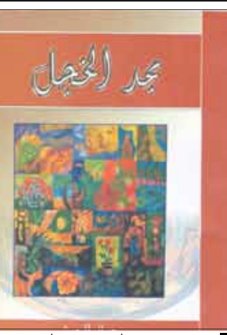
■ غلاف ديوان (مجد الخجل)

وخرج الكتاب في طبعة أنيقة من الحجم الصغير وغللاف ملون جوي ١٢٠ صفحة وضم بين دفتيه (٢٣) نصا شعريا من قصائد كتبت خلال عقدي الثمانينات والتسعينات. جميع القصائد في الديوان تنتمي إلى شعر الحداثة الذي يبنّي على الصورة الفنية في تسلسلها وما تحده من تناغم إيقاعي داخلي في النص بعيدا عن الالتزام بالإيقاع الصوتي المعروف بقصيدة التفعيلة. ومن أجواء القصود المتضمنة في الديوان نقرأ في قصيدة "ضدهم"