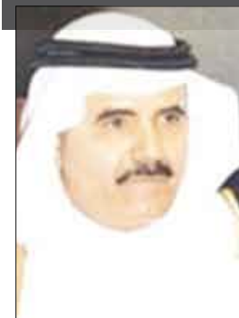
تركي بن عبد الله السديري

إن مناسبة الحج تُعتبر تواجداً مهماً لتطوير مفاهيم المسلمين حول أهمية الحوار الذاتي إسلامياً، وأن الفرقة والجهل والغلو عقبات تهدد آمال المسلمين هي حقائق موجودة لكنه لم يتم الالتفات حولها ولو حدث ذلك منذ مئات الأعوام لما تورط المسلمون بواقع الأوضاع الدموية التي فرقت بينهم وفرقت أيضاً ما بينهم وبين غيرهم، وليت أن ذلك باختلاف وجهات نظر ولكن من ناحية بعض المسلمين حدث ذلك بفعل ضراوة الانغلاق والجهل وعدوانية الرؤية إلى كل ذي وجهة نظر أخرى..