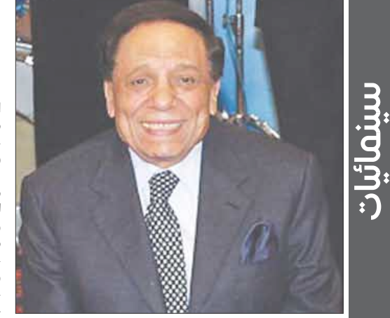
■ الفنان عادل إمام

□ القاهرة / منابعات : أخيرا استطاعت شركة «جود نيوز» للإنتاج السينمائي الحصول على موافقة مبدئية من النجمين عادل إمام ومحمود عبد العزيز على المشاركة في فيلم يجمع بينهما. بدأت محاولة الجمع بين النجمين منذ العام الماضي، ورفض عبد العزيز المشاركة في فيلم «حسن ومرقص»، بسبب خلافات قديمة مع الزعيم بسبب منافسة النجمين على بطولة مسلسل «دموع في عيون وقحة»، التي انتهت وقتها بحصول عادل إمام على الدور، حسب صحيفة «الأنا».