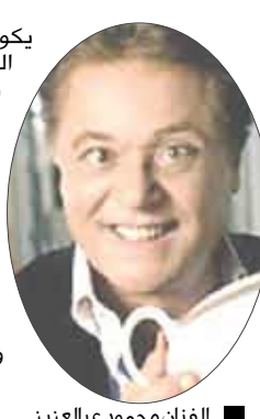
■ الفنان محمود عبدالعزيز

□ القاهرة / منابعات : أخيرا استطاعت شركة «جود نيوز» للإنتاج السينمائي الحصول على موافقة مبدئية من النجمين عادل إمام ومحمود عبد العزيز على المشاركة في فيلم يجمع بينهما. بدأت محاولة الجمع بين النجمين منذ العام الماضي، ورفض عبد العزيز المشاركة في فيلم «حسن ومرقص»، بسبب خلافات قديمة مع الزعيم بسبب منافسة النجمين على بطولة مسلسل «دموع في عيون وقحة»، التي انتهت وقتها بحصول عادل إمام على الدور، حسب صحيفة «الأنا».