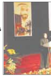
لبنى القاسمي تؤكد أهمية تعزيز ركائز الهوية الوطنية

وأكدت معالي الشخبة لبنى القاسمي أن دولة الإمارات العربية المتحدة تقدم للعالم اليوم مثلاً رفيعاً نموذجياً اقتصادياً واجتماعياً نموذجياً تتطابق مع استخدام مقوماتها وإمكاناتها الواسعة والقوية لتنمية اقتصاد متنوع وتنافسي. وأكدت معالي الشخبة لبنى القاسمي أن الإصلاحات الشاملة التي تكاد تكون الأوسع على مستوى المنطقة وورشة التخطيط للمستقبل بشكل مبدع وعلى التركيز على قطاع التعليم والاهتمام بمرحلتها بما يواكب متطلبات العصر والتحديات العصرية واستراتيجية الانفتاح والتطوير واسع النطاق لقاعدة صناعية ذات ميزات نسبية وقطاع سبلي تترجم بين الأصيل والحداثة وقاعدة واسعة من الموارد البشرية الوطنية المتميزة كلها تشكل الرؤية التي تدعم عملية الانتقال بدولة الإمارات من مرحلة التنمية الداخلية إلى مرحلة التكامل مع الاقتصاد الدولي حيث تبنوا اقتصاداً وطنياً مركزاً تنافسياً مع الاقتصاديات المتقدمة في العالم يمكنه من مواجهة التحديات والتغيرات المحلية والإقليمية والعالمية المختلفة.