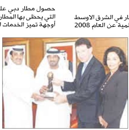
مطار دبي يفوز بجائزة أفضل مطار بالشرق الأوسط 2008

يذكر أن "جوائز السفر الدولية" تم إطلاقها في العام 1993 وتعد واحدة من أبرز الجوائز الدولية ذات الصلة بعالم السفر بهدف زيادة المنافسة بين المطارات وشركات الطيران للارتقاء الدائم بنوعية الخدمات التي توفرها لعملائنا.