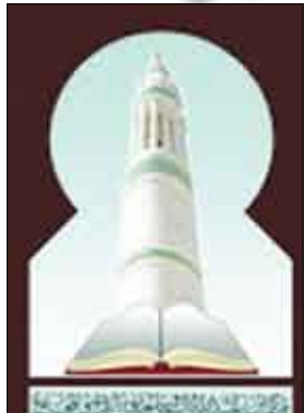
■ شعار المركز

في جولة في ربوع الهند أقام مركز ابن عبيد الله السقاف لخدمة التراث و المجتمع وضمن أنشطته الأسبوعية المنتظمة محاضرة قيمة بعنوان ( الدور الفكري والسياسي للحضارة في الهند ) استعرض فيها العلامة و المؤرخ السيد / جعفر بن محمد السقاف تاريخ هجرة الحضارة إلى الهند و البصمات التي حفرها في تاريخ هذه الحضارة القيمة ، و الإبداع المعرفي الذي نتج عن التلاقح الفكري بين