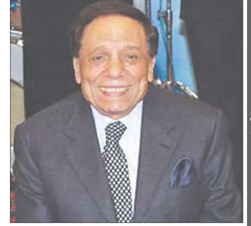
■ الفنان عادل إمام

□ القاهرة / منابيات : أخيرا استطاعت شركة «جود نيوز» للإنتاج السينمائي الحصول على موافقة مبدئية من النجمين عادل إمام ومحمود عبد العزيز على المشاركة في فيلم يجمع بينهما. بدأت محاولة الجمع بين النجمين منذ العام الماضي، ورفض عبد العزيز المشاركة في فيلم «حسن ومرقص»، بسبب خلافات قديمة مع الزعيم بسبب منافسة النجمين على بطولة مسلسل «دموع في عيون وقحة»، التي انتهت وقتها بحصول عادل إمام على الدور، حسب صحيفة «الأخبار».