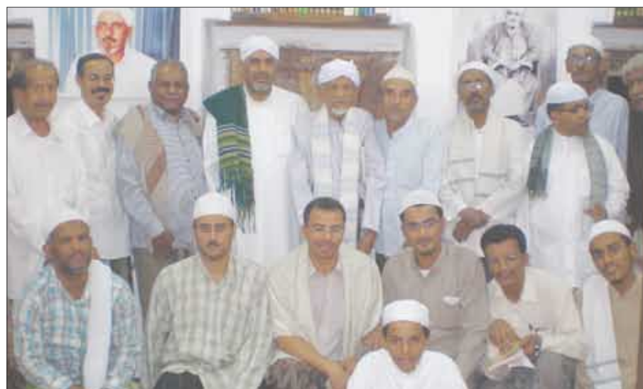
■ أعضاء مركز ابن عبيد الله السقاف لخدمة التراث

القسم الأول هم من هاجروا إلى الهند و استقروا فيها استقرارا كاملا حتى توفوا هناك ، و القسم الثاني هم من هاجروا و لم يقطعوا علاقتهم بالبلاد و كانوا يترددون عليها لغرض الزيارة و التعليم أو لأغراض أخرى ، أما القسم الثالث فهم الذين ولدوا في الهند و استقروا هناك و لم يترددوا على وطنهم الأصلي حضرموت