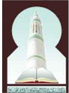
■ شعار المركز