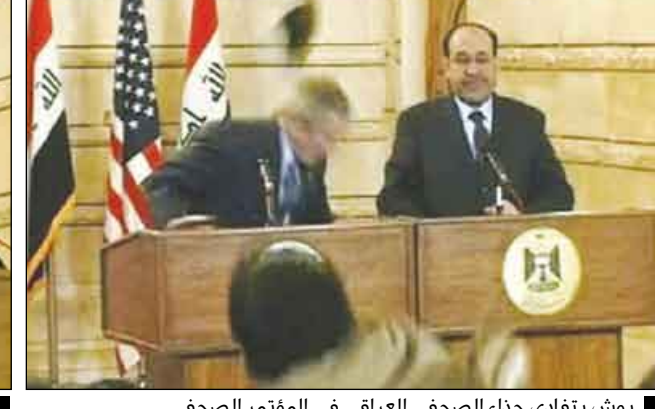
بوش يتفادى حذاء الصحفي العراقي في المؤتمر الصحفي