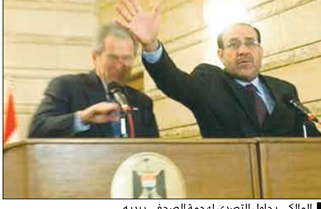
الملكاني يحاول التصدي لهجمة الصحفي بيديه