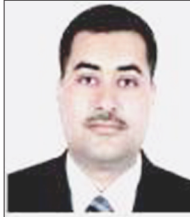
م /عمر الحياتي

اليمن، السعيدة، دولة سبا وحضرموت، أوسان، معين، كلها مسميات على كثرتها تحكي عن دولة ودويلات حكمت أرض اليمن تلك المنطقة العربية التي تقع في الجنوب الغربي من جزيرة العرب وهي منطقة شبة صحراوية فيما عدا المناطق الجبلية وخاصة المنطقة الوسطى والغربية والممتدة من باب المندب إلى تخوم منطقة الطائف بالمملكة العربية السعودية .