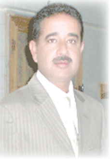
الشاعر السوري / فاروق طوزو