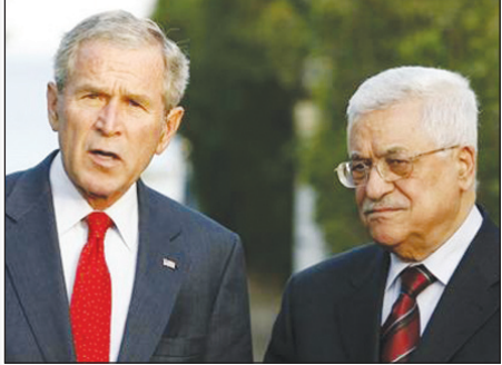
عباس وبوش في لقاء بشرم الشيخ يوم 17 مايو ايار 2008م

رام الله/14 أكتوبر (رويترز): قال أحد مساعدي الرئيس الفلسطيني محمود عباس ان عباس سيعقد لقاء أخيراً مع الرئيس الأمريكي جورج بوش في واشنطن يوم 19 من الشهر الجاري. وقال المفاوض الفلسطيني صائب عريقات إن المحادثات ستكون اجتماع عمل تتضمن مراسم توديع، وأضاف أن عباس وبوش سيتناقشان عملية السلام. وكان بوش يأمل أن يدفع إسرائيل والفلسطينيين باتجاه التوصل لاتفاق سلام قبل أن تنتهي فترة بقائه في المنصب في يناير. لكن كل الأطراف قالت إن هذا الهدف لا يمكن تحقيقه.