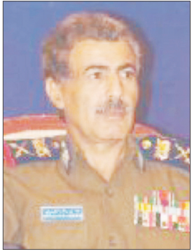
مطهر رشاد المصري

رفع اللواء الركن/ مطهر رشاد المصري وزير المصري بريقة تهنئة إلى فخامة الأخ الرئيس علي عبد الله صالح رئيس الجمهورية بمناسبة عيد الأضحى المبارك الذي يتزامن مع احتفالات شعبنا بالعيد الـ 41 ليوم الاستقلال الـ 30 من نوفمبر وفي ظل ما يشهده الوطن من إنجازات ومكاسب كبيرة في شتى نواحي الحياة وعلى مختلف الأصعدة .