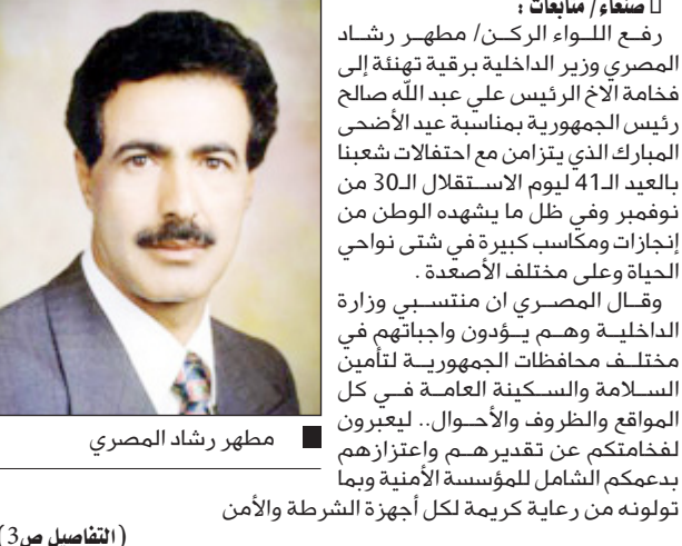
مطهر رشاد المصري

صنعا / متابعات : رفع اللواء الركن / مطهر رشاد المصري وزير الداخلية برفقة تهنئة إلى فخامة الأخ الرئيس علي عبدالله صالح رئيس الجمهورية بمناسبة عيد الأضحى المبارك الذي يتزامن مع احتفالات شعبنا بالعيد الـ 41 ليوم الاستقلال الـ 30 من نوفمبر وفي ظل ما يشهده الوطن من إنجازات ومكاسب كبيرة في شتى نواحي الحياة وعلى مختلف الأصعدة. وقال المصري إن منتسبي وزارة الداخلية وهم يؤدون واجباتهم في مختلف محافظات الجمهورية لتأمين السلامة والسكينة للعامة في كل المواقع والظروف والأحوال... ليعبرون لفخامتهم على تقديرهم واعتزازهم بدعمكم الشامل للمؤسسة الأمنية وبما تولونه من رعاية كريمة لكل أجهزة الشرطة والأمن