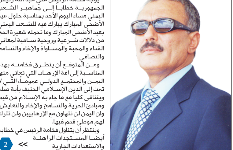
صنعا / متابعات :

يوجه فخامة الرئيس علي عبدالله رئيس الجمهورية خطاباً إلى جماهير الشعب اليمني مساء اليوم الأحد بمناسبة حلول عيد الأضحى المبارك يبارك فيه للشعب اليمني بعيد الأضحى المبارك وما تحمله شعيرة الحج من دلالات شرعية وروحية سامية لمعاني الفداء والمحبة والمساواة والإخاء والتسامح والتضامني. ومن المتوقع أن يتطرق فخامته بهذه المناسبة إلى أمة الإله التي تعاني منها اليمن والمجتمع الدولي عموماً، التي لا تمت إلى الدين الإسلامي الخفيف بأية صلة ويتنافى كلياً مع ما جاء به الإسلام من قيم ومبادئ الحرية والتسامح والإخاء والتعايش. وأن اليمن لن يتهاون مع الإرهابيين ولن تترك لهم موطئ قدم فيها. وينظر أن يتناول فخامة الرئيس في خطابه أيضاً المستجدات الراهنة والاستعدادات الجارية