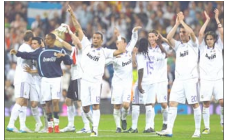
فريق ريال مدريد