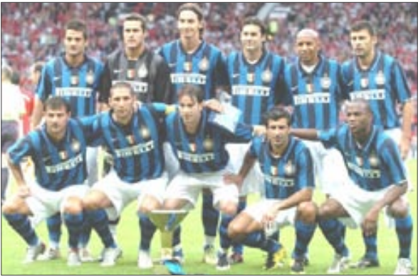
فريق إنتر ميلان