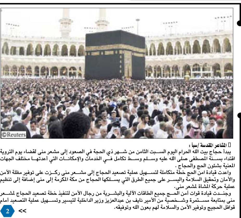
المشاعر المقدسة/سبأ: يبدأ حجاج بيت الله الحرام اليوم السبت الثامن من شهر ذي الحجة في الصعود إلى مشعر منى لقضاء يوم التروية اقتداء بسنة المصطفى صلى الله عليه وسلم وسط تكامل في الخدمات والإمكانات التي أعدتها مختلف الجهات المعنية بشؤون الحج والحجاج.

وإعداد قيادة أمن الحج خطة متكاملة لتسهيل عملية تصعيد الحجاج إلى مشعر منى ركزت على توفير مظلة الأمن والأمان وتحقيق السلامة واليسر على جميع الطرق التي يسلكها الحجاج من مكة المكرمة إلى منى إضافة إلى تنظيم عملية حركة المشاة لشعر منى.